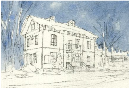
1、空から塗ります 雪粒を目立たせるには 空も建物も できるだけ濃く塗っておく必要があります