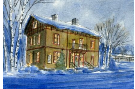
5、壁面の模様や影を細部を少しずつ仕上げっていきます