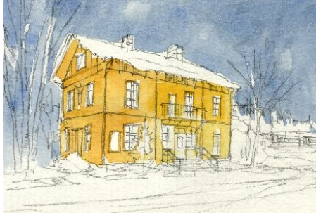
2、壁面は黄色なので まずは黄色系の色でベタ塗りしておきます