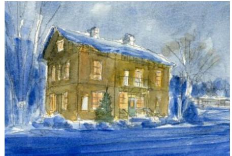
4、冬の北欧は昼でも暗いので 壁面も暗くしておきます 窓は明るい色で残しておきましょう