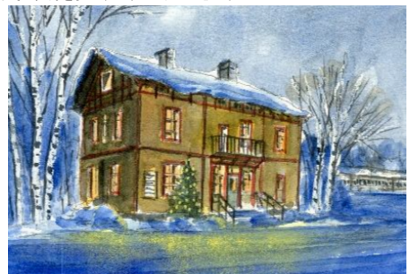
6、雪面に落ちる灯火の反映は 黄色のパステルで描いておきます 最後に「修正液」で雪粒を描いて完成です