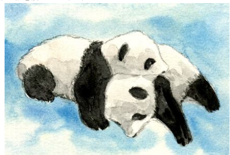
6、体の影も濃くしていきます 最後にパンダ本体の影もつけて完成です