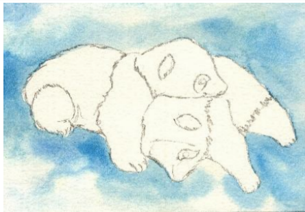
1、構図が重要です 2匹の顔がよく見えて うまく重なっているところにしました