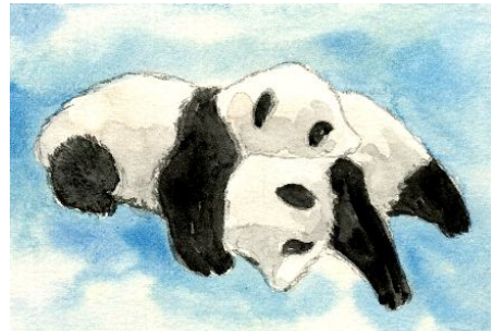
5、気を付けて、少しずつ黒を濃くしていきます