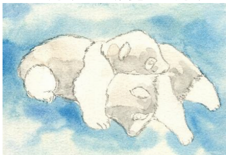
3、薄く影をつけておきます 特にパンダのお腹の下のほうです