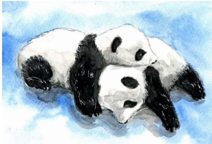
これが完成した絵です