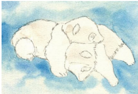
2、背景はブルーを滲ませて塗っておきます パンダは薄く桃色で塗っておきます