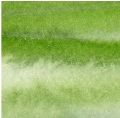
5、手前の草原は 滲みをそのまま生かして描きます