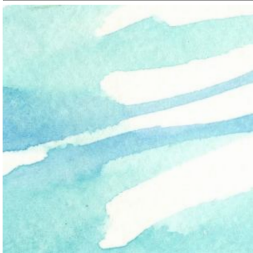
1、主題の空は「ホリゾン・ブルー」と「パチダー・ブルー」の2色を混ぜて塗っています