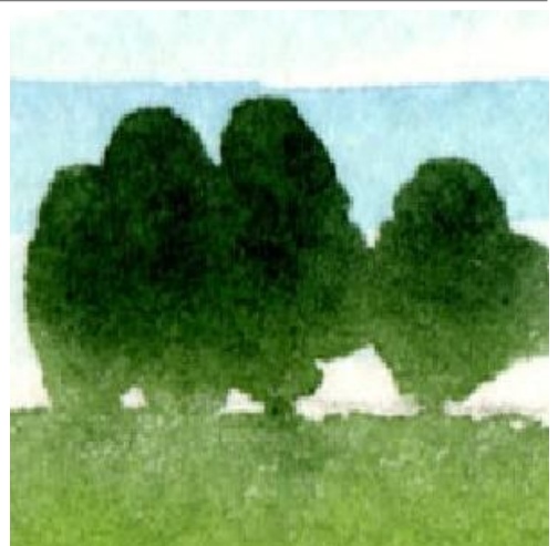
3、樹木は「サップ・グリーン」と「シャドウ・グリーン」を混ぜて一筆で描きます