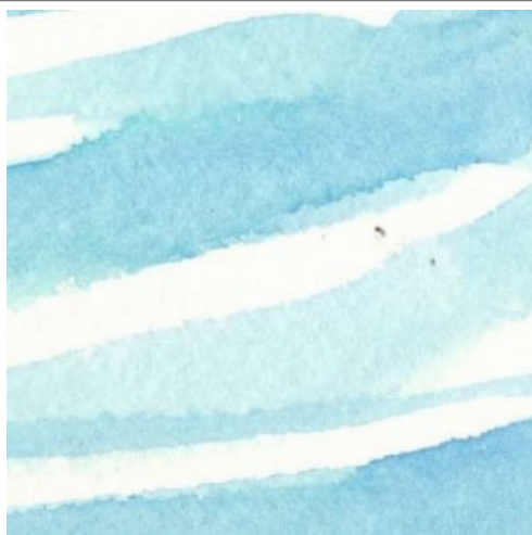
2、一つのストロークを長く なるべく筆の絵の具を 紙の上に落とし切ります