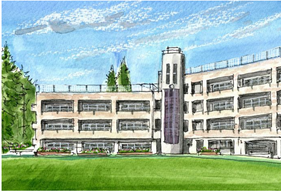
これが完成した絵です

校庭を芝生にする学校が増えています 春の校庭はその芝生が青々と茂り 朝子どもたちが来るのを待っています このご時世で 思い切り遊べる場所が少ない子どもたちにとって 広い校庭で走り回るひとは 大切な時間となっていることでしょう