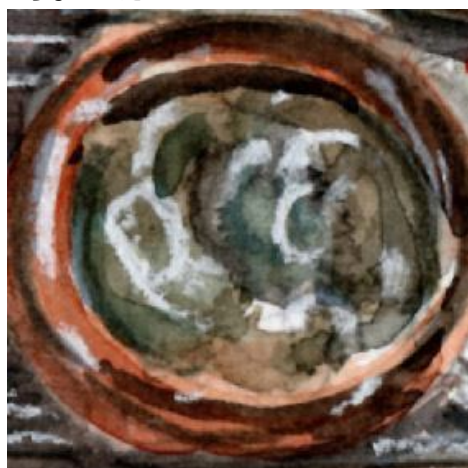
5、味噌汁は 難易度が最大の題材 特にネギとワカメの表現が困難