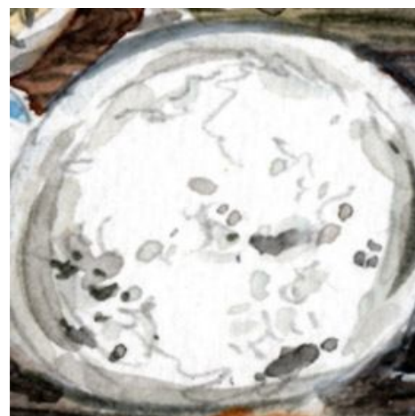
6、しかし最も表現困難なのは たぶんご飯でした 色が無いので どうにもなりません