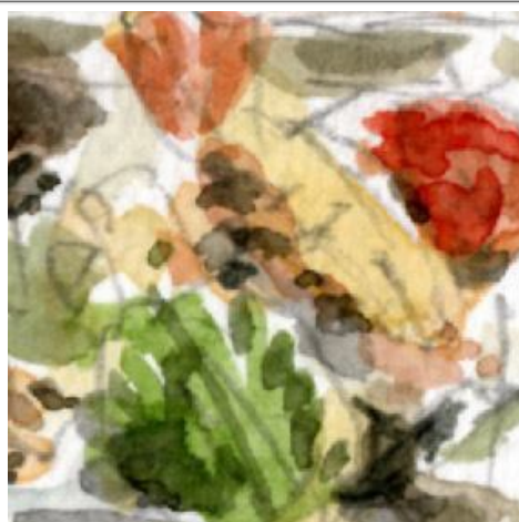
2、主題の「天ぷら」が その質感が難しい 特に「海老天」をどう描いたら良いか よくわからなかった