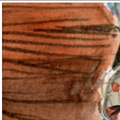
1、テーブルの木目模様 まず茶色の下地を塗って 乾いてから 薄いセピアで木目を描きます