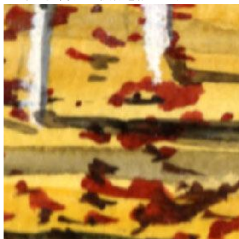
5、林床の落葉松の落ち葉は 黄色+黄土色を横のタッチで描きます その上に落ち葉を描きます