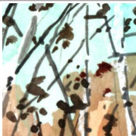
1、白樺の梢にわずかに残った枯れ葉 色は「こげ茶+紫」を使っています