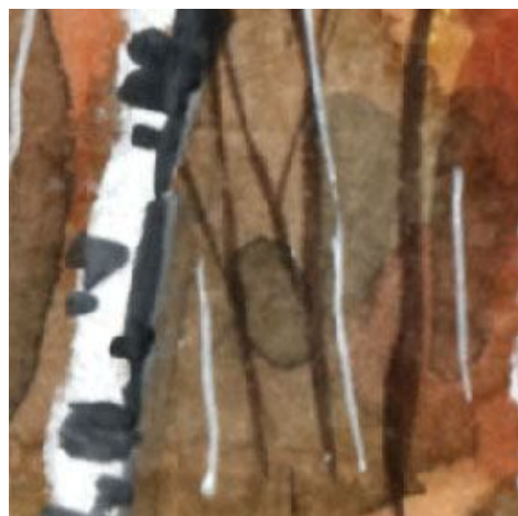
4、森の奥は非常に暗くしました これは一部明るくしてもよかったと思いました