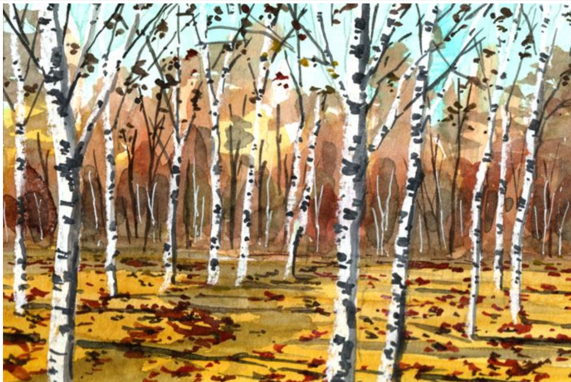
これが完成した絵です

どこから降ってきたのか 落葉松の落ち葉が積もり 金色の林床になっています 落葉樹の葉もほぼすべて散り 歩くたびにカサカサ音をたてます 白樺の木々は やがて訪れる初雪を 静かに待っているようです