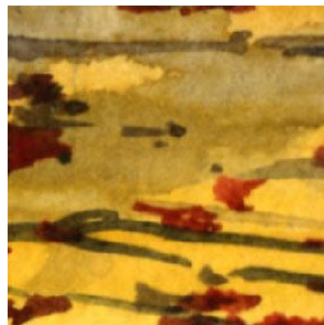
6、木々の影も描いておきます 影は個々の幹の右側に描きます