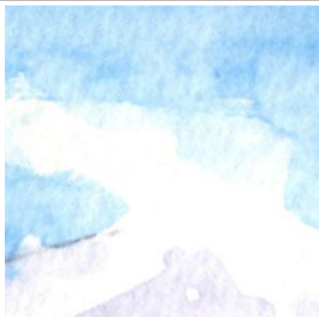
1、浅間の白煙は できるだけ空の色から塗り残して表現します