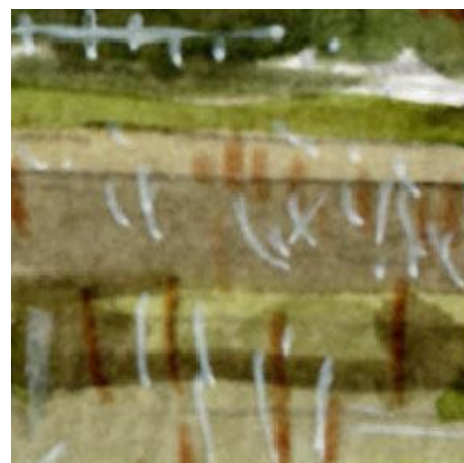
6、手前の収穫が終わったトウモロコシ畑 いろいろ工夫しましたが難しいですね