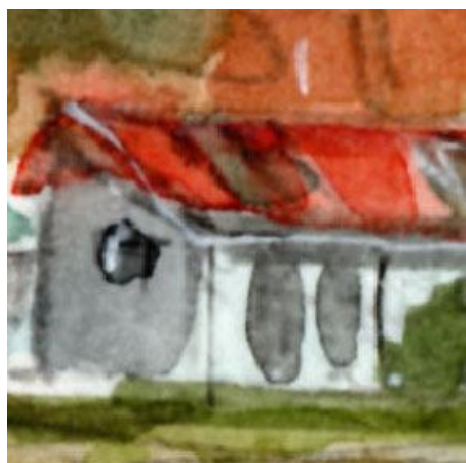
4、農家の納屋は 立体感と屋根の雰囲気 が難しいです