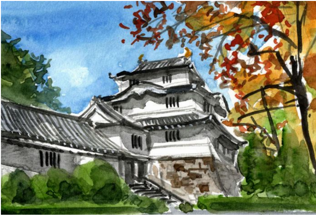
これが完成した絵です

お城は苦手です お城の天守に上るのが苦手なのではなく お城を描くのが苦手なのです 日本にはたくさんのお城がありますが 今までに松本城と小田原城しか描いたことがありません このお城は気に入りました しかしどのお城だったか忘れてしまいました たぶん関東地方のお城か 関東地方以外のお城のどちらかです