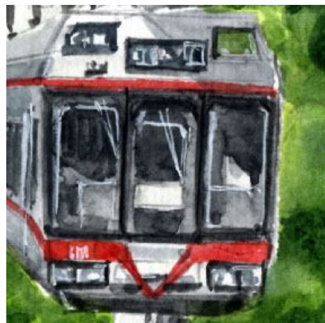
4、モノレールも鉄道車両の一種ですから 前面(顔)が大切です 窓の中は暗くします