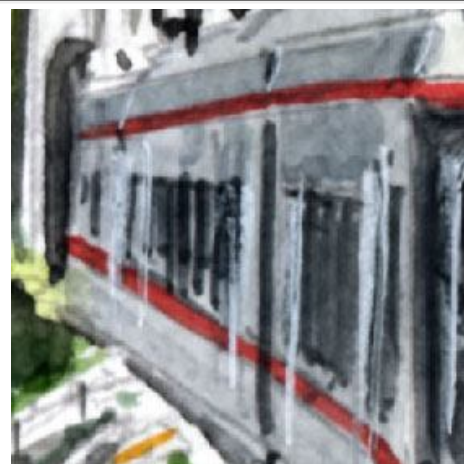
3、銀色の車体は難しいです 赤いストライプで車両の遠近感を表現します