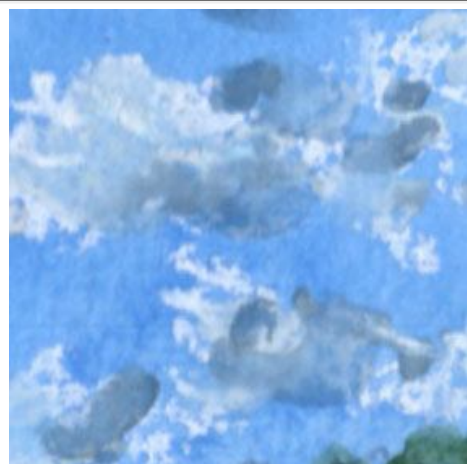
1、夏雲は 白のパステルで描き 最後に影をつけました