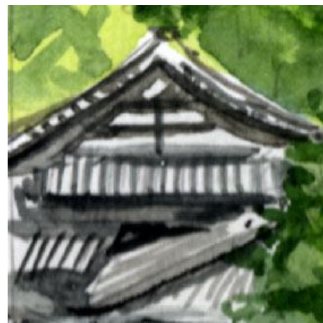
6、道路左手の民家 もしかするとお寺さんかもしれません これも良いアクセントになります