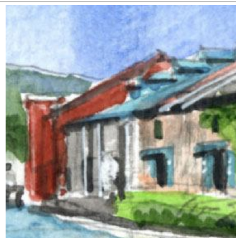
3、この構図では 運河沿いの倉庫群が非常に重要です それぞれの建物の色のちがいを丁寧に観察します