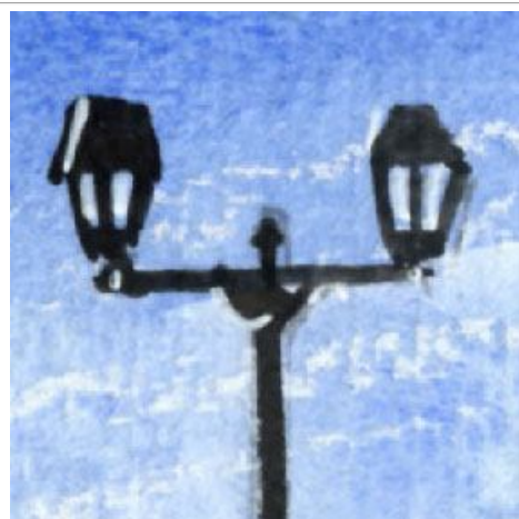
1、特徴のある街路灯 もう少し丁寧に描けばよかったです