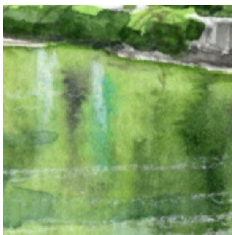
5、水面の反映 ツタの緑が基本ですが 倉庫の壁や扉の色の反映も描きます