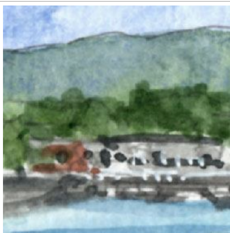
2、遠くの山と街並み 運河にかかる橋もあまり丁寧にすぎないように描きます