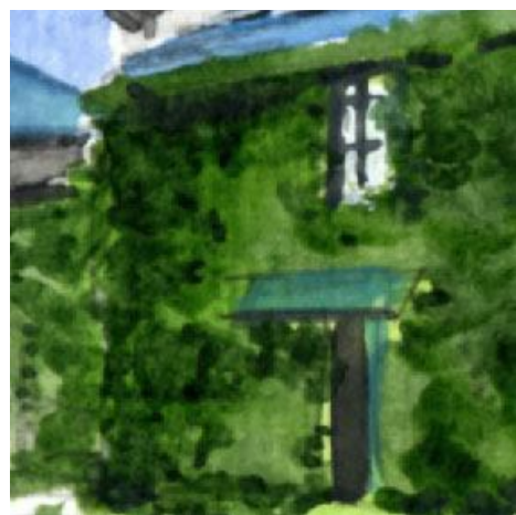
4、ツタで覆われた倉庫の壁 これだけぎっしりとツタに覆われた様子は かなり難しいです