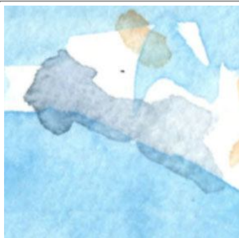
1、空の色は「ホリゾンブルー」という色に少し他の青を加えて表現 雲は塗り残して影をつけました