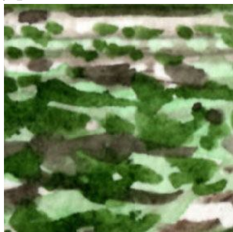
4、キャベツ畑は 表現が今一で 何度描いても「もっと研究が必要だ」と思います