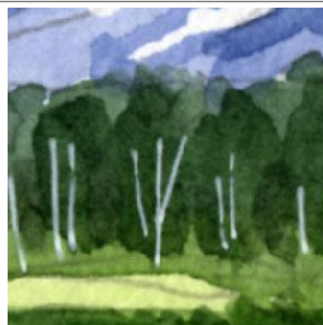
3、遠くの森は 思い切り暗くしました そのあと不透明の白ペンで 白樺を描きました