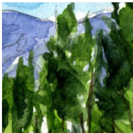
5、並木の木々は 少し粗いタッチで描きました 一応右側から光が当たっていると意識します