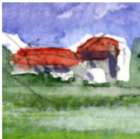
5、農家の建物。建物の周囲は、あえて少し白く残しました。これは意外にも効果的です。