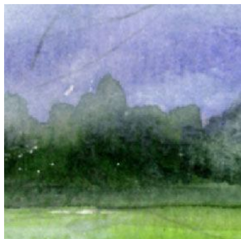
4、中景の森にも霧をかけます。「霧が一瞬晴れようとしている」様子を表現します。