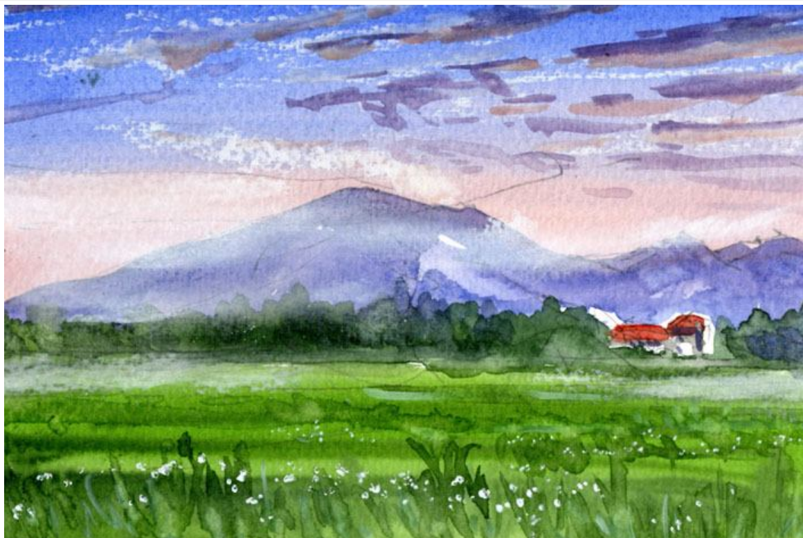
これが完成した絵です

今年の梅雨は本当に雨が多く、浅間をほとんど見ていません。しかし雨上がりの一瞬、霧の隙間から姿を現すことがあります。まるで蜃気楼のような幻想的な浅間の姿です。