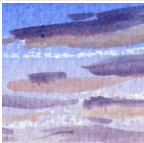
1、やや夕暮れの空をイメージしています。雲は白ではなく、少し色をつけました。