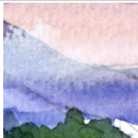
3、山肌にまとわりつくような層雲。これは白のパステルを指先で伸ばして表現します。