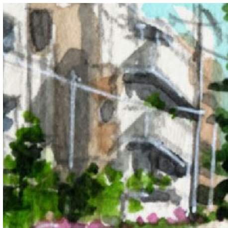
5、遠くのマンションも できるだけ丁寧に描きます すべての建物に「同じ方向から太陽光が当たっている」と意識して描きます