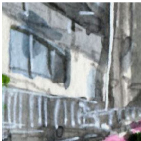
2、歩道とマンションの近くにある白いフェンス これは最後に不透明の白ペンで描きました