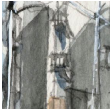
4、マンションの壁面の斜めの影が 右手からの「日差し」を表現しています