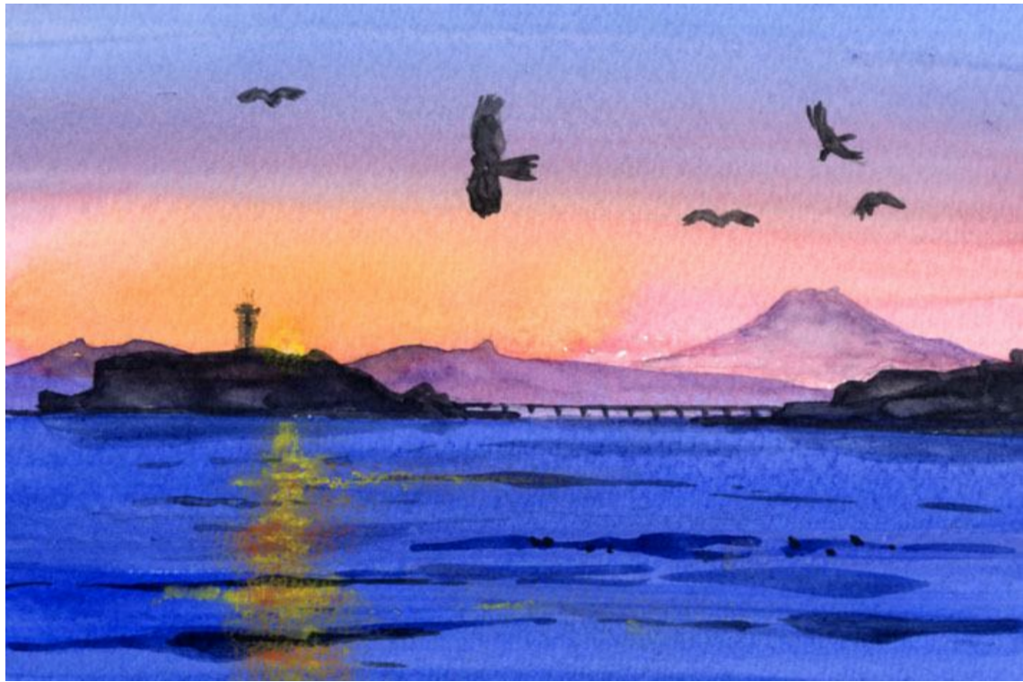
これが完成した絵です

今日は鎌倉・江の島に行く予定でした「そよぐの仲間」との大イベントの日だったのです 全員が一生懸命に準備してきました しかしイベントは中止 朝からすばらしい快晴だったので 私はいっそのこと一人で行きたいとも思いましたが それはできないことです 江の島にはライブカメラがあります 私は夕方にそれをポーッと眺めていました 恐ろしいほど美しい暮れなずむ江の島と 遠い富士が映っていました この景色を仲間と見たかったのですが「幻の夕暮れ」となっていました いつか実現させたいです