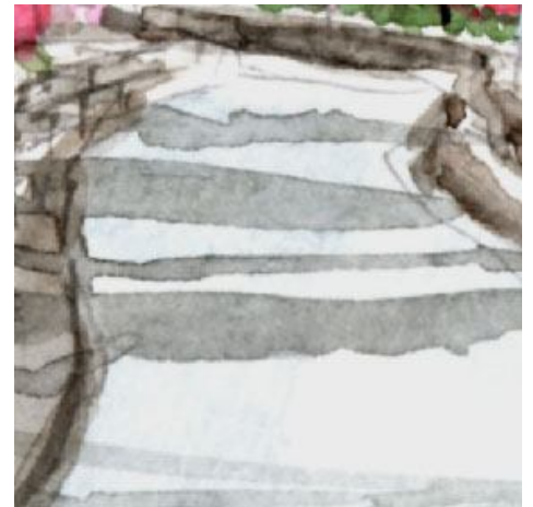
6、路面に落ちた影で「木漏れ日」を表現します 影はあまり濃い色にならないように