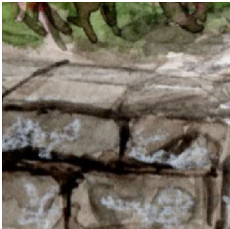
4、道の両側の石は 立体感も質感もなかなか手ごわい相手です