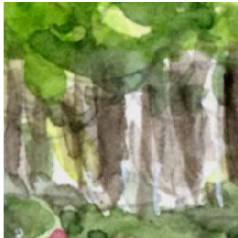
2、遠くの樹木は 少し薄く(彩度を下げて)描きます この手法でも遠近感が表現できます