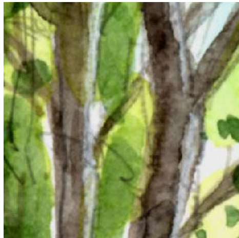
5、右側から光が当たっていると意識して描きます 樹木も右側を明るくします