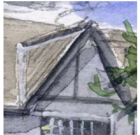
3、側面の張り出し屋根も大切です こちらは日かげの部分なので 全体的に暗くします