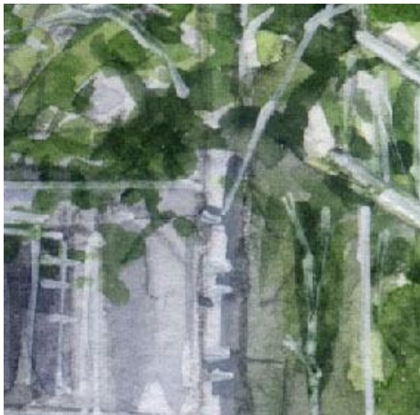
4、右手にある一本の白樺は重要です 新緑の白樺の葉も 丁寧に描きます