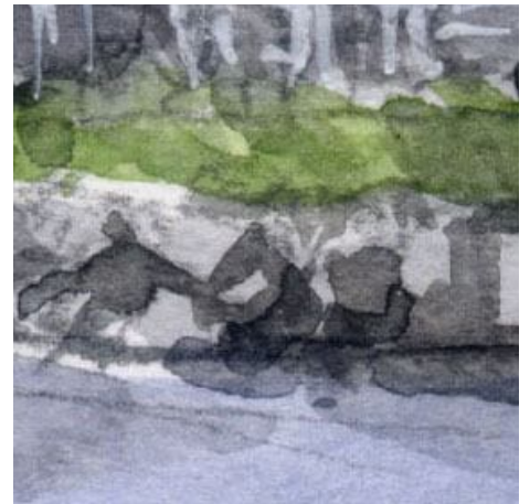
6、建物の植え込みを囲む「浅間石」(火成岩) ゴツゴツとした立体感が難しいです