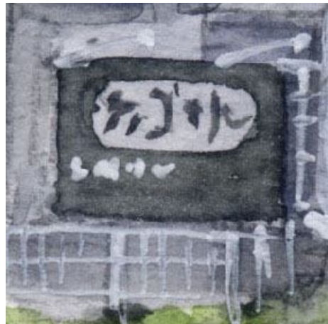
5、店の看板も大切です しかし文字だけを丁寧に描くと 全体のバランスが崩れます