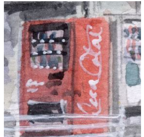
6、自販機も駅前らしさを表現しますが もっと古風な自販機を描けばよかったです