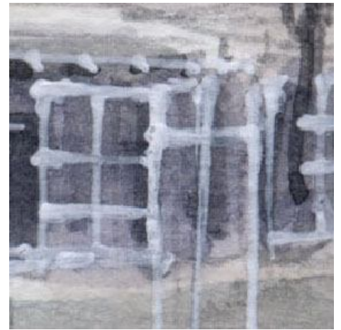
3、窓枠は白の不透明ペンであとから描きましたが もう少し丁寧なほうが良かったです