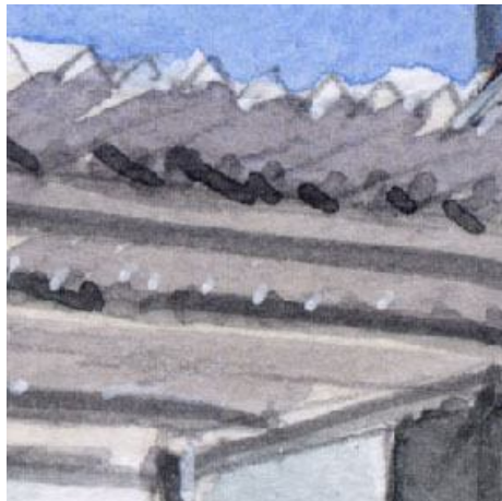
5、波板のような仮屋根 この立体感をもう少し丁寧に描くべきでした