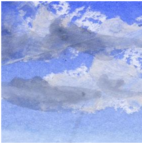
1、雲(積雲)は最後にパステルで描きます その上に薄くジョンブリアン(肌色)を塗って そのあと影をつけます