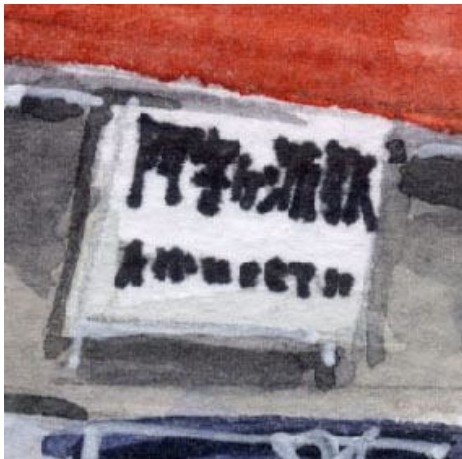
4、駅名板は大切な要素ですが 字をペンで書いたのが失敗でした 面倒でも細い筆で描くべきでした