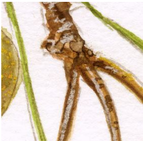
4、果実を支えている枝の表現 この枝の一本一本にも光沢の表現が必要です