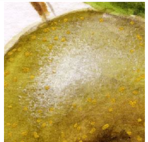
3、ナシの実の果皮は 光沢の表現が大切です 絵の中の全部の実の同じ面に 白のパステルで光沢を表現します