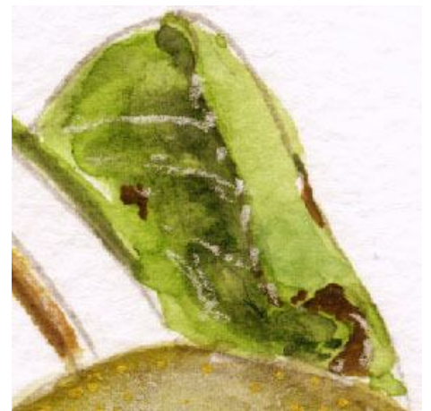
6、カールした葉 虫が食って変色した部分なども できるだけリアルに描きました