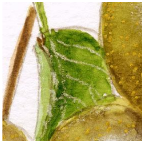
5、果実の表現は難しいですが 葉はもっと難しいです 葉脈はもっと考えて描くべきでした