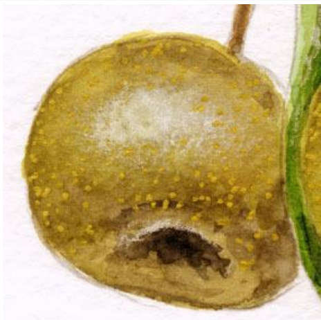
1、この絵では ヤマナシの果実の立体感がすべてです 一つの果実はこんな感じです