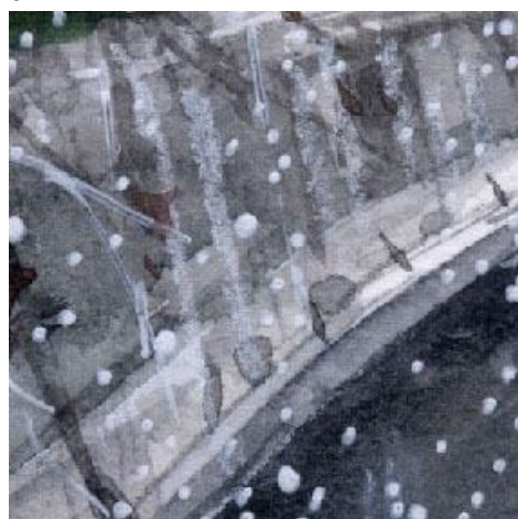
4、コンクリートの護岸は 色も大切ですが その「傾き」をどう表現するかも大切です