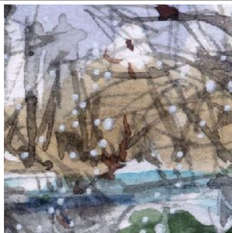
2、遠くの桜の木々 今の時期に葉はありませんが 枝の重なりがこんな色に見せています