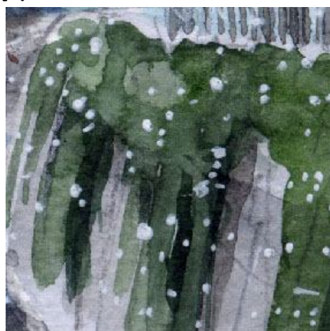
5、左岸(画面右側)は ツタ(アイビー)が長く伸びています この立体感も難しいです