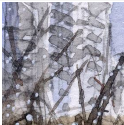
1、背後のマンション マンションであることがわかる程度に あまり丁寧に描きません