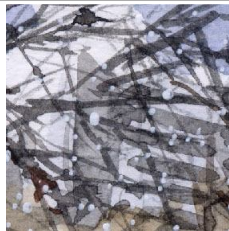
3、桜の枯れ枝の重なり 細筆を使って速いタッチで 時間をかけずに描き切ります