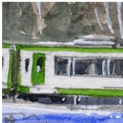
5、列車の描写で一番むずかしいのは 床下機器だと思えます 丁寧に描き過ぎてもいけません