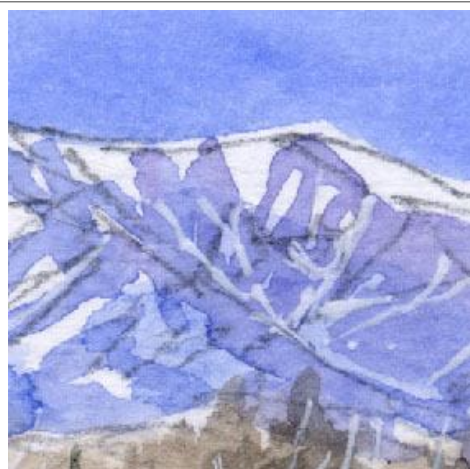
2、山嶺の谷間の表現が難しいです 地形をよく観察して描きます