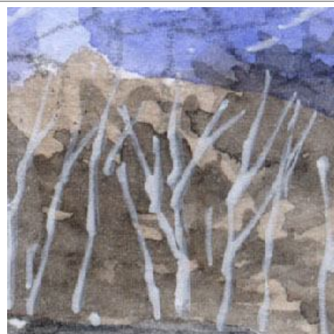
3、白樺は高原列車らしさを表現する 重要なモチーフです