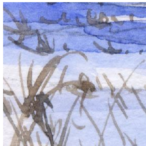
6、手前の平地はたぶん高原野菜畑でしょう 今は枯草のある雪原です