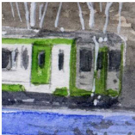
4、前面は「列車の顔」です できるだけ正確に描きます、