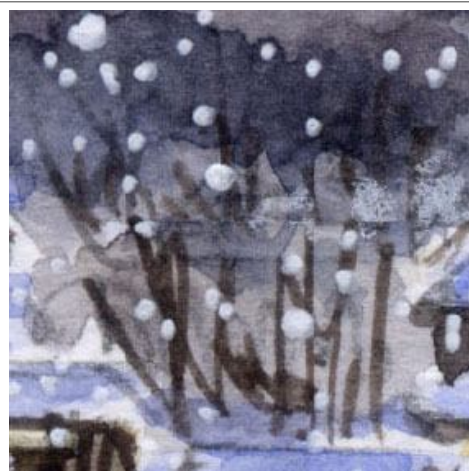
3、雪の中の冬枯れの樹木は難しいです できるだけ細い筆で 素早いタッチで描きま す