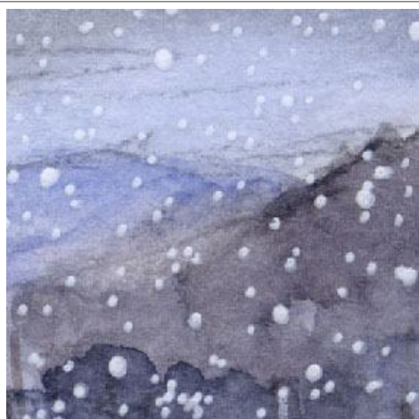
2、近くの丘よりも遠くの山のほうが淡くなる ように描きます 雪でぼやけているのです