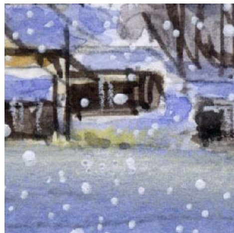
6、灯火の雪上への反映もなかなか難しい です 黄色のパステルで表現しました