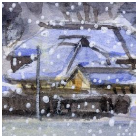
4、雪の中の民家群 夕暮れ時なので 屋 根の雪も白ではなく 青で立体感をつけます