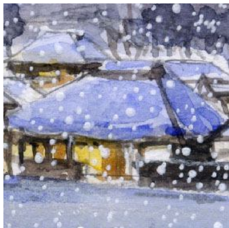
5、一番の右の民家は 特に丁寧に描きた い対象です 家の中の明るさの表現が難し いです