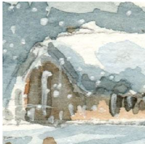
5、小屋は少し大き過ぎました この大きさなら もう少し手前に描くべきでした