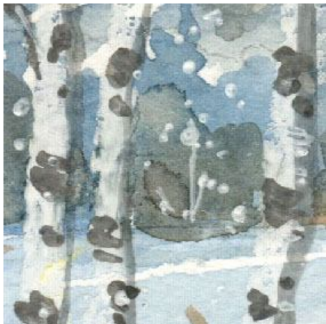
4、白樺は2本にしようか3本にしようか迷いましたが やはり奇数本のほうが安定するような気がします