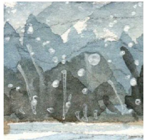
3、中景の森は 青だけでなく「セピア」(こげ茶色)も混ぜています