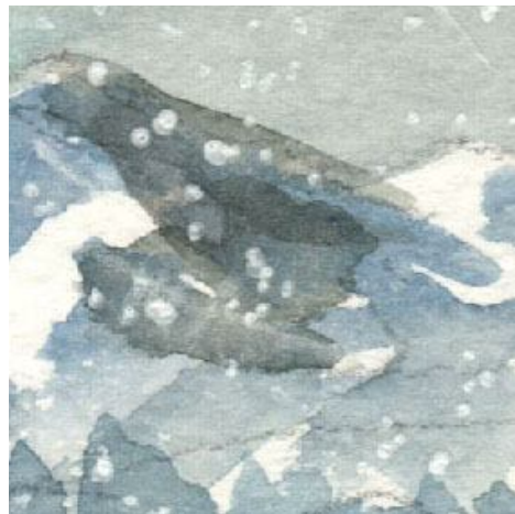
2、遠くの山は さまざまな「青」を重ねます ただ雪が降っているのもっと淡く描けばよかったです