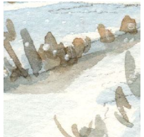
6、雪の上に見える枯草も もっと細い線で丁寧に描けばよかったです