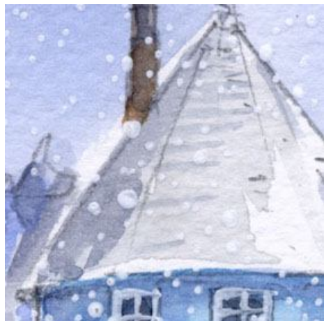
4、多角錐の屋根の立体感 は 明るさの違いで表現します