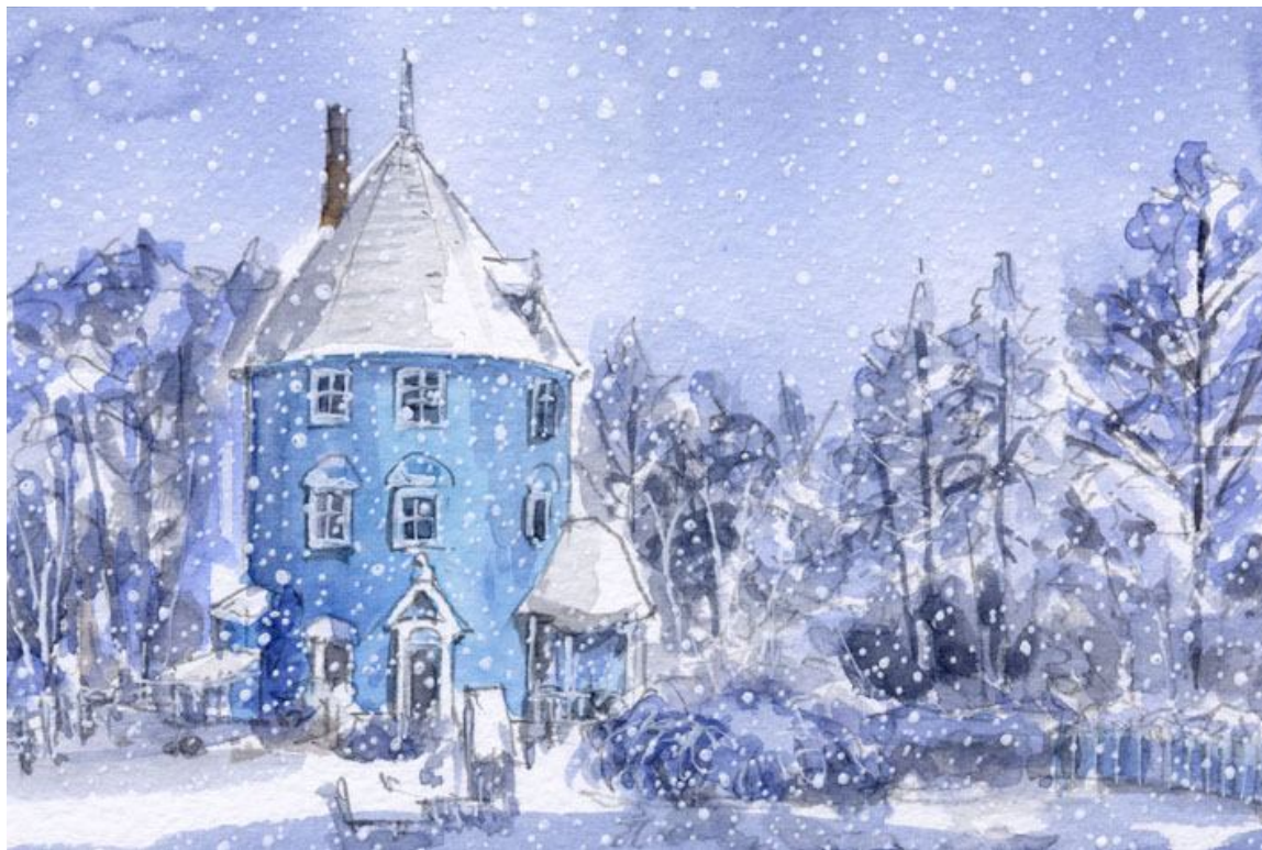
これが完成した絵です

冬の風景は色彩に乏しいものですが 時に雪の日の絵は 青一色だけで描ききれることもあります 青一色といっても 実はいくつかの青を使っています この絵では「ウルトラマリン」「コバルトブルー」「パチダーブルー」「ホリゾンプール」の4種類です この青い家は いつか森のはずれに建ててみたいです