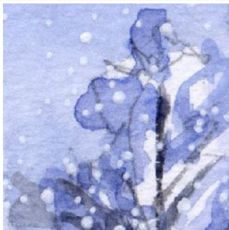
2、背後の針葉樹も 青だけで描きます 少しだけ夕暮れ時を意識して 暗めに描きました