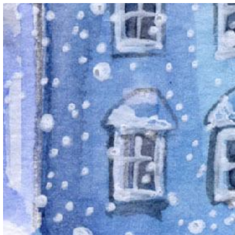
5、円柱型の建物の立体感 は 端ほど青を重ねて表現します もっと強調しても良かったと思います