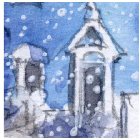
6、建物正面の入口 白い縁取りは うまく塗り残せるように努力しました