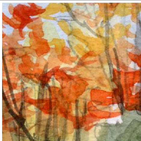
2、坂の奥の赤く紅葉した木々 樹木の幹の隙間は もっと暗くしてもよかったです