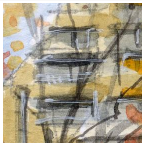
3、坂の右側のマンション 手前に木があるのですが あとから窓枠の白を入れて 失敗しました