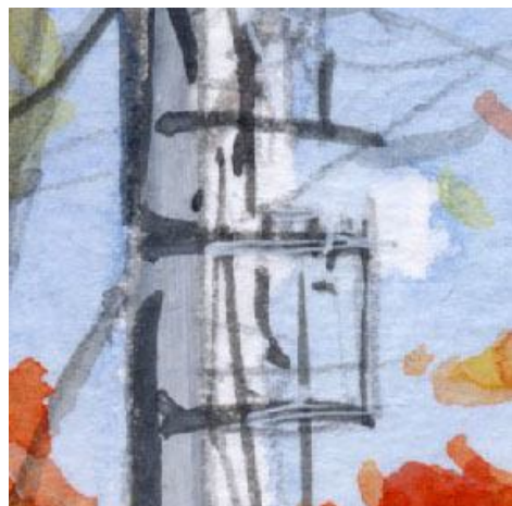
4、電柱は省略しても良かったのですが 私は電柱が好きなので 描いておきました