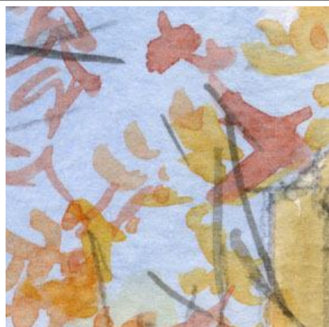
1、紅葉の木々の葉 何色かの絵の具を使います 筆は軽妙に動かします