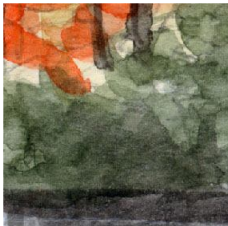
5、坂の右側の植え込み これは常緑の灌木なので シャドウ・グリーンで描きました