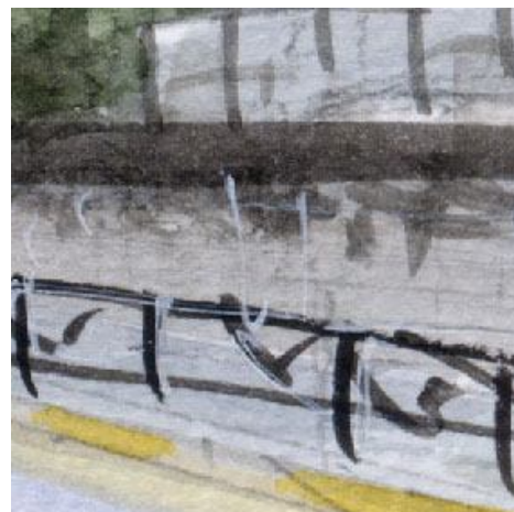
6、車道と歩道を隔てる柵 これはもっと丁寧に描くべきでした