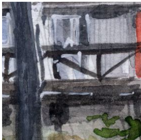
4、高床のテラスは ブラックではなく セピア(こげ茶)と紫を混ぜます 床下はより暗くします