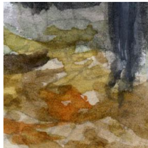
6、地面は 積もった落葉を重ねます ここには落葉だけでなく 枯れ枝も描けばよかったです