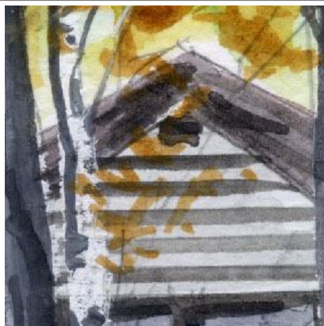
2、主題の建物の切妻の部分 ここは樹木に隠れないように構図を考えます