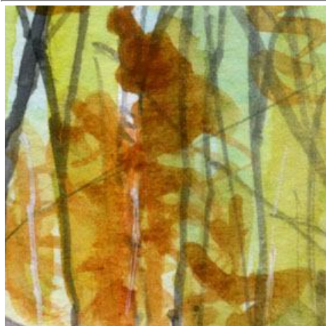
1、背後の紅葉した森の色 黄色 ジョン・ブリアン(肌色) 茶色の順に重ねます