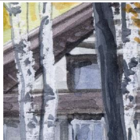
3、建物の手前に樹木がある構図は なかなか大変です 白樺はあとから描きます