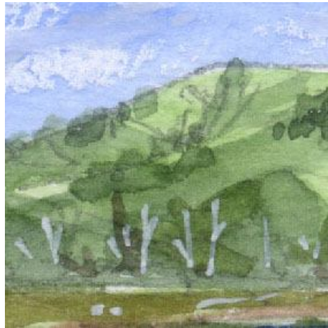
2、遠くの山と白樺 山は何色かの緑を重ねました 遠くの白樺は 不透明インクの白いペンで描いています