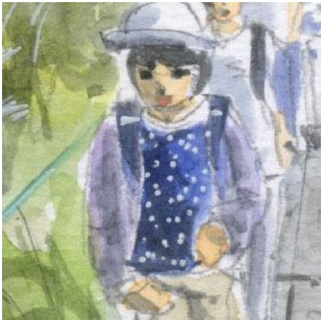
4、主題の子ども 楽しそうな表情にしようと思いましたが なかなかうまく描けません