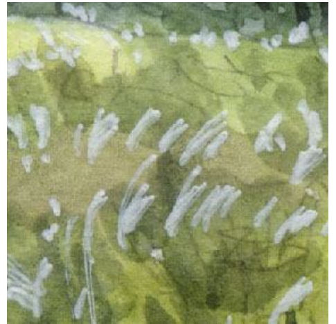
3、ススキの群棲も 不透明インクの白ペンで絵書き増した しかしこれはマスキングのほうが良かったです