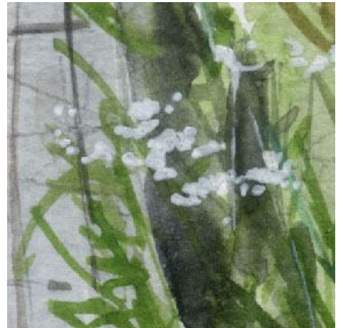
6、木道の脇は暗くします 更に草を軽いタッチで描き 白い花を付け加えます