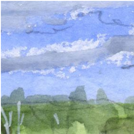
1、雲は 空の青が乾いてから パステルで描きました 影はもう少し丁寧につけるべきでした