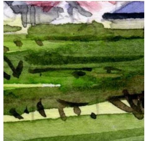
6、ブドウ畑の表現は もっと研究が必要だと思いました