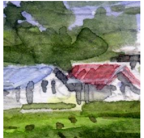
3、ブドウ畑濃しの民家 全部向きが同じで 少しわざとらしくなっていました