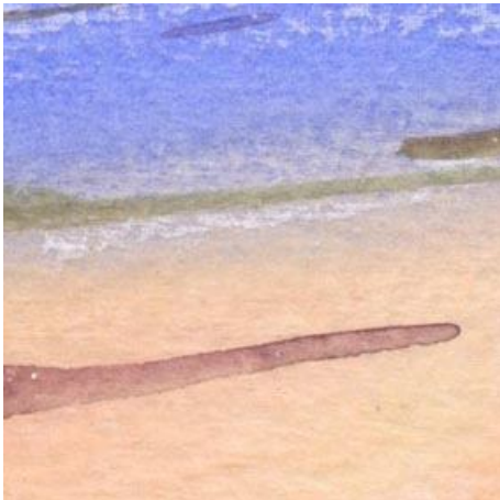
1、空は青~ジョン・ブリアン(肌色)のグラデーションで 雲は薄い紫で 横にひきます