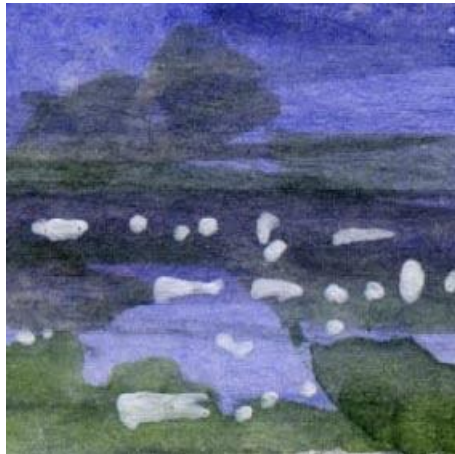
5、遠くの山の裾野の建物 白の点描にしてみたが もう少し工夫がほしかったです