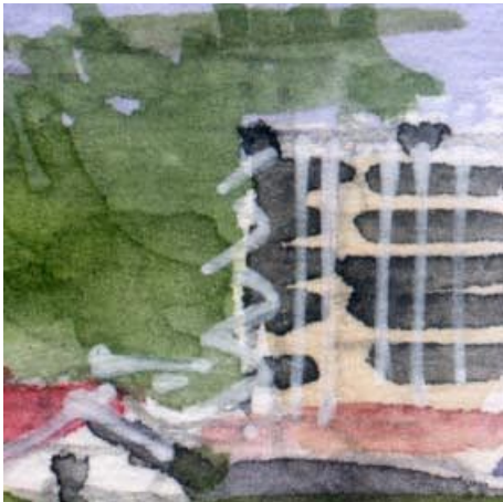
4、マンションと思われる建物 手前の民家との大きさの対比が 少しおかしいです