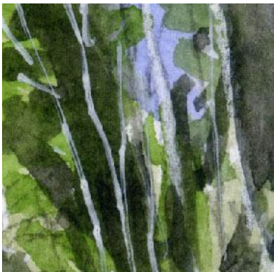
4、右手の林は 何の樹木がよくわかりません 樹皮は白のパステルとペンを使いました