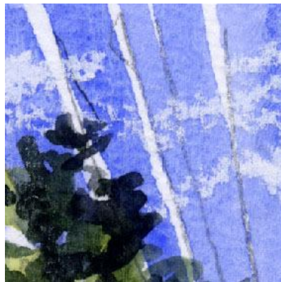
2、絵の中に電線を決して描かない人もいますが 私は好んで描きます 空を少し塗り残すような感じで