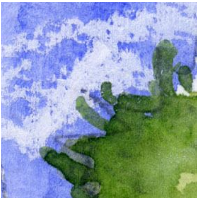
1、空はコバルト・ブルーで 雲(積雲)は白のパステルであとから描きました