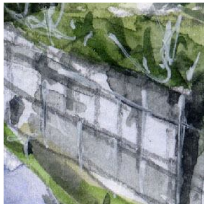
5、右手の古いブロック 表面に少し苔を描けばよかったですと思いました