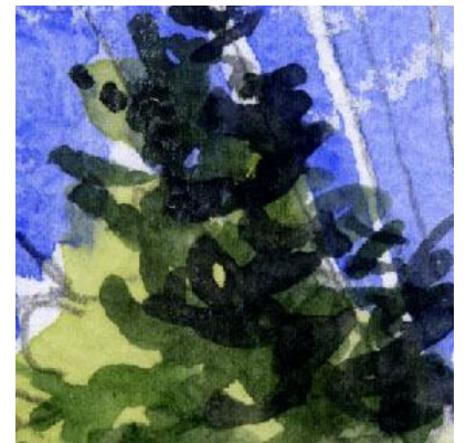
3、画面左側から陽光が当たっていることを意識して描きます 樹木もそうです