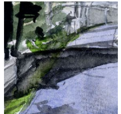
6、路面に落ちた影 建物も電柱も樹木も 左側から影を描きます