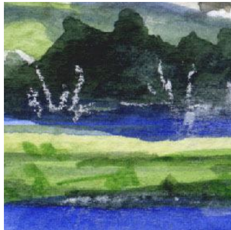
5、対岸の樹木 白樺を想定して 白い幹を細いパステル鉛筆で描きます