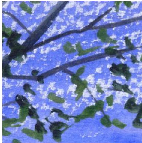
2、白樺の枝と葉は 空と雲の手前にシルエット風に描きます