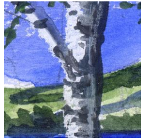
3、白樺の幹 山も樹も左側から光が当たっていると意識して描きます