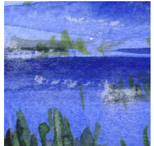
6、水面の水草は もっと細い筆で描いたほうがよかったです