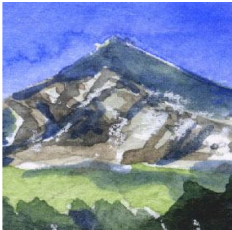
4、主題の磐梯山 特に右側の峰は岩肌の荒々しさを表現します