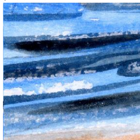
6、波は失敗 もっとゆっくり丁寧に筆を動かせばよかったです