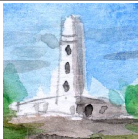
3、灯台はもう少し丁寧にしたほうがよかったと 完成してから思いました しかしあえてそのままにしました