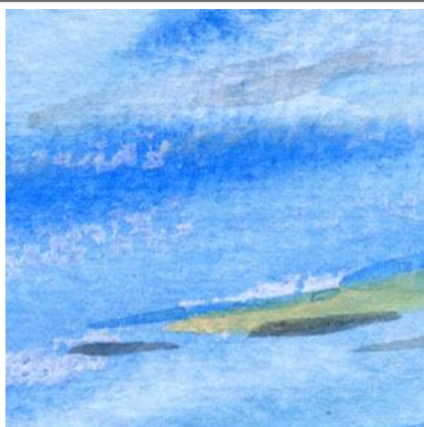
1、梅雨明けの空 巻雲や巻積雲の残る青空を描きたかったのですが 難しいです