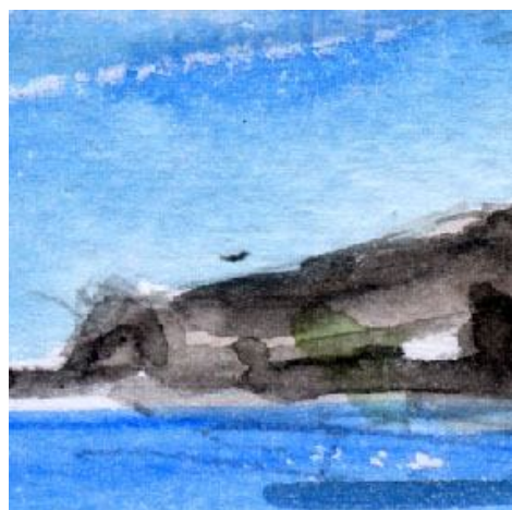
5、岩には ジョンブリアン(肌色)を使えばよかったと思いました