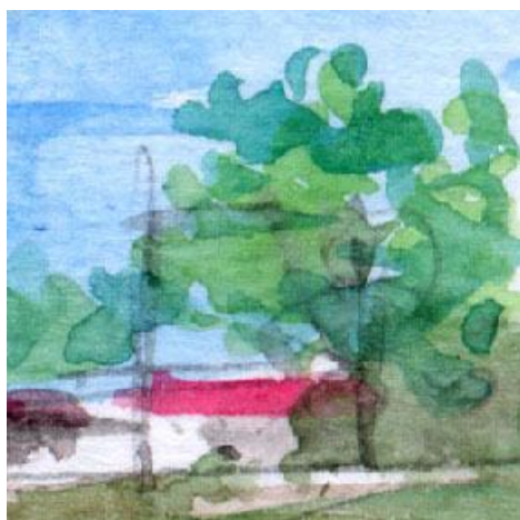
4、岬の台地の建物と樹木 この絵ではこの部分が一番気に入っています