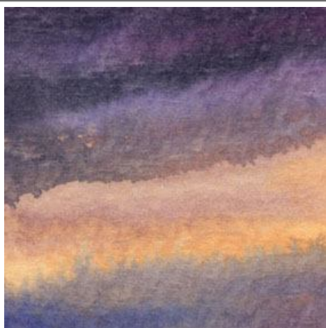
1、空模様は何色も絵の具を重ねた時の偶然の滲みをそのまま生かします