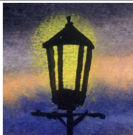
3、主題の街灯は あまりうまく描けませんでした もっと繊細に描きたかった