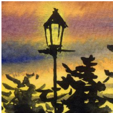
4、奥の街灯のほうが少し気に入っています 樹木とのバランスも考えて