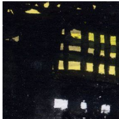
6、建物の灯りは 黒の塗り残しで表現します シルエットで建物の立体感を出すのは難しい