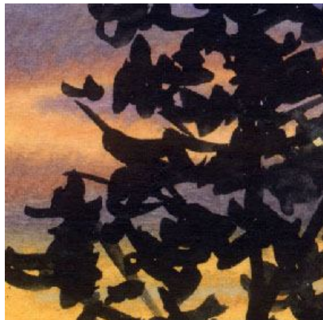
5、すべての地上物はシルエットで描きます 樹木は特に大切です