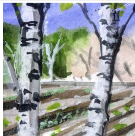
3、白樺の幹は パステルで白く描き起 したあと 樹皮の模様をつけるので すが 何度描いても難しいです