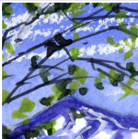
2、白樺の葉は 緑を何色か重ねて描きま す 特にシャドウ・グリーンが重要で す