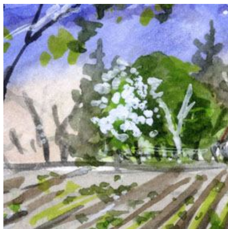
5、コブシの花 山桜 それに針葉樹 中景 に春らしい樹木を配しました