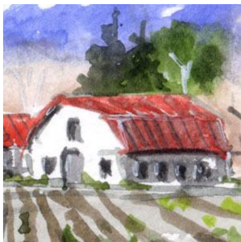
4、赤いギンブレル屋根の建物は 高原ら しさの表現に役かきます