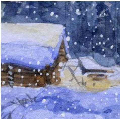
4、屋根の雪の立体感には 同じブルーを何度も重ねて表現します