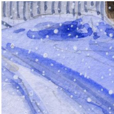
5、アプローチの雪と 除雪した雪の立体感も ブルーを何度も重ねて表現します