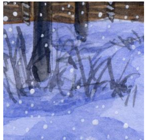
6、雪の上に見える枯れ草 これは画面にアクセントを与える 大切な「部品」です