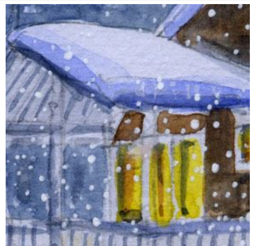
3、周囲を暗くすることで 玄関の明るさも引き立ちます