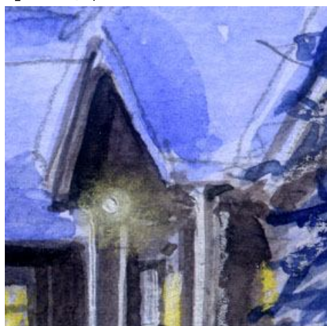
4、外灯りは 雰囲気が出るように パステルで少し滲ませるように描きました