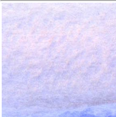
1、地平線のすぐ下に太陽があるので 空はこんな色になります 「ヴィーナス・バンド」といいます