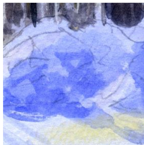
6、除雪した雪の堆積は 立体感が今一つでした これも研究中です