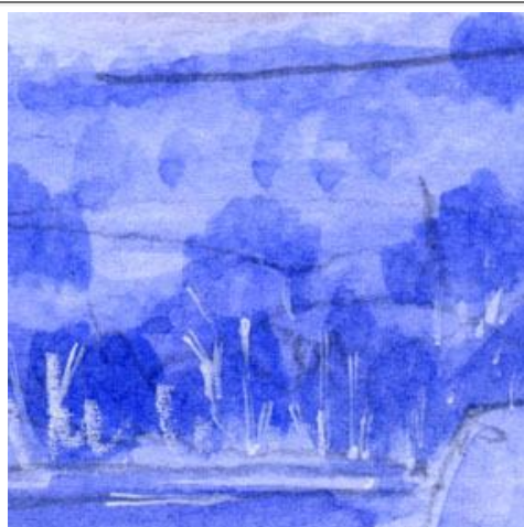
2、湖の対岸の丘には針葉樹の森 湖畔には白樺を描きます