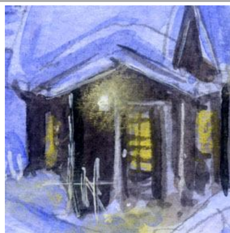
3、コテージの入口 外は極寒ですが 中の暖かさも表現したいと思いました