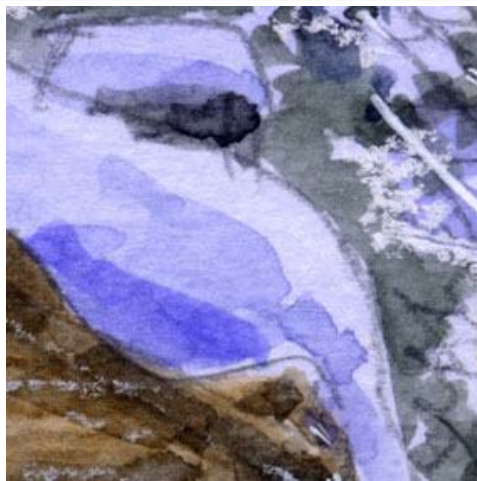
2、屋根の積雪には ポリュームと立体感を持たせます 基本はブルーで影をつけます