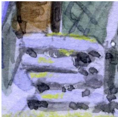
5、雪が積もった階段も なかなか難物です ところどころ薄いブラックを置きます