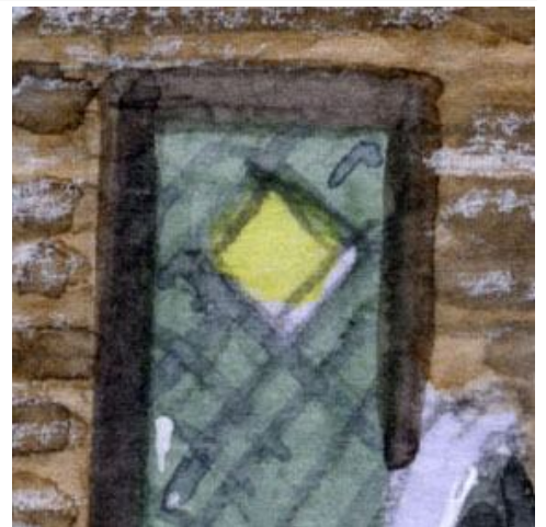
3、ドアは深い緑色 ダイヤ型の窓灯りがポイントでしょう