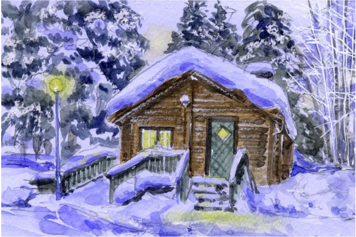
これが完成した絵です

ストウゴ(Stugo)というのは スウェーデン語で「小屋」「キャビン」という意味です ユッカスヤルビのアイスホテルの近くに かわいらしいストウゴがあります 私はこの小屋を以前訪ねた時にも描いたことがあります 一度描いた建物には 何か懐かしさを感じます