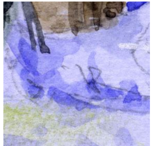
6、地面の雪の立体感も ブルーで描きます 濃淡を強調するのが大切です