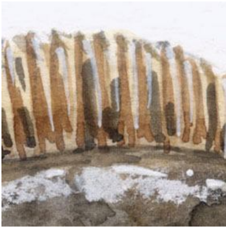
1、細かい筋のあるひれは あきらめずに根気よく描きます