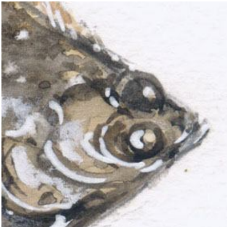
4、カレイはほとんど海底にへばりついて生活しているので 眼は2個とも体の片方にあります 立体感が難しい