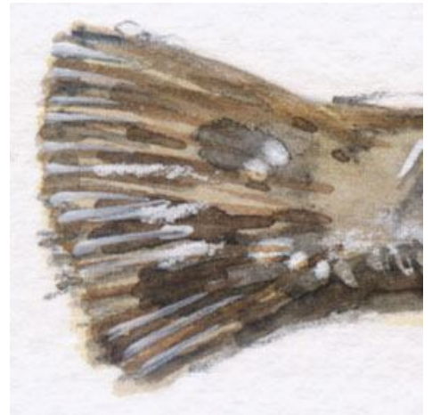
6、小さな尾ひれで カレイらしさを表現できます しかし尾は難しいです