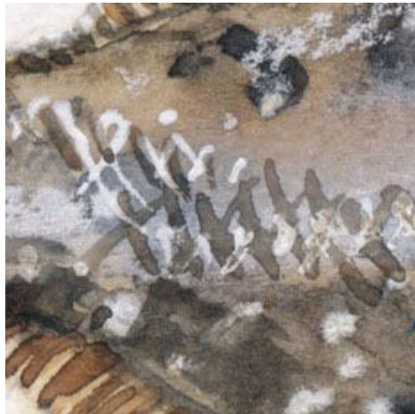
5、カレイにも鱗(うろこ)はあるのですが あまり目立ちません 体の一部に描くことにしました