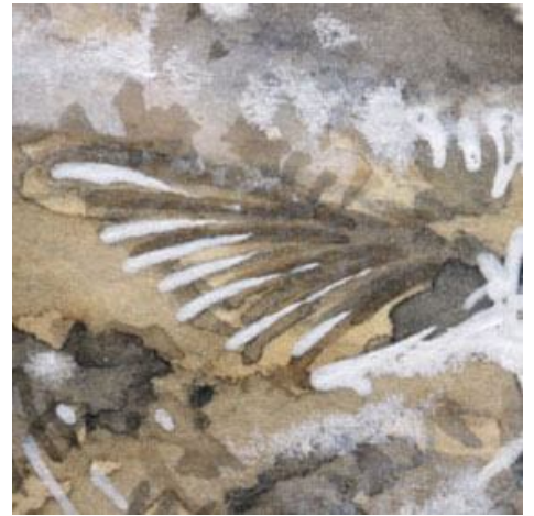
3、胸ひれは実に目立たないのですが よく見るとエラのそばにあります