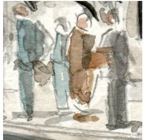
6、ホームの人物は重要です 年齢や性別など いろいろなタイプを描くと良いと思います