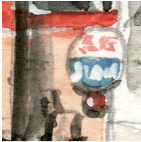
2、丸いヘッドマークも 四国急行の名物でした「急行よしの川」という列車です