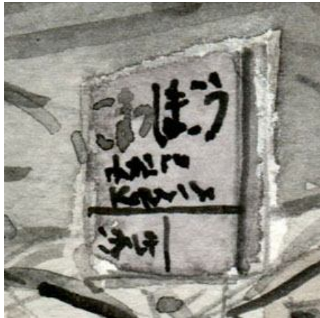
5、駅舎を描いたわけではないので 駅名板が「駅たる唯一の証拠」です 文字はやや失敗しました