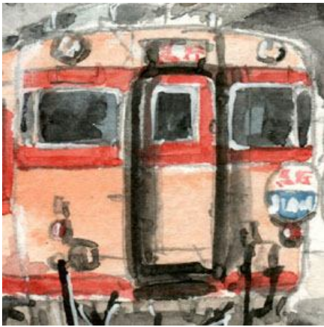
1、ディーゼル急行は かつての四国国鉄の名物でした この塗装の列車を描くと とても心が落ち着きます