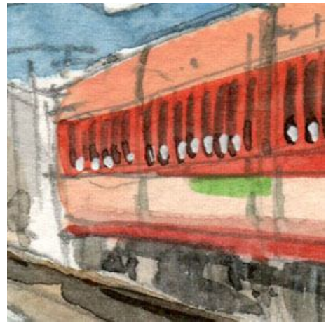
3、列車の側面は 丁寧になりすぎないほうが良いです 半室グリーン車の帯も描いておきました