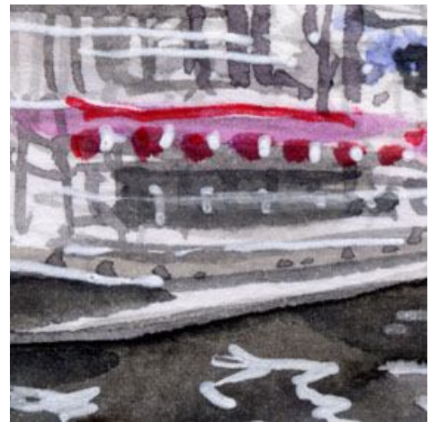
3、屋形船も難しいです 列になってぶら下がっている赤い提灯が重要です