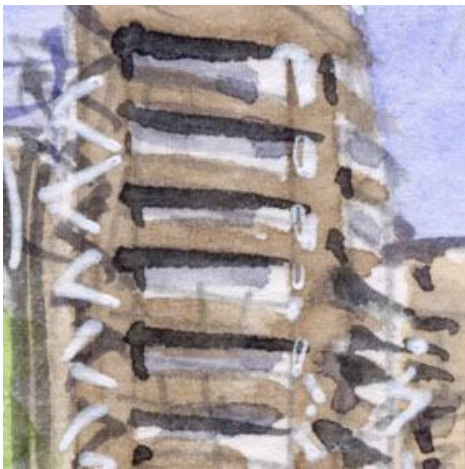
1、背後のビル 非常階段を描くと 本物っぽく見えます