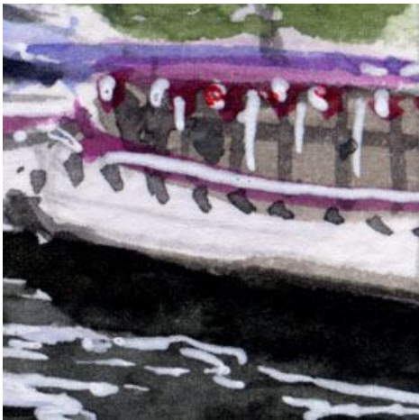
4、右側の屋形船は 画面では少し小さいですが しっかり描く必要があります