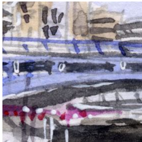
2、主題の橋は実は難しい 橋によって全く形状がちがうので よく観察することが大切です