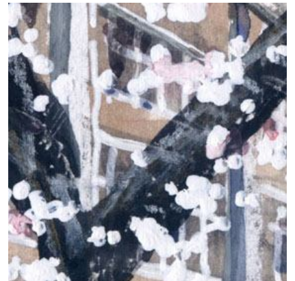
3、幹の手前の花も効果的です この表現は 修正液が一番うまくいきます