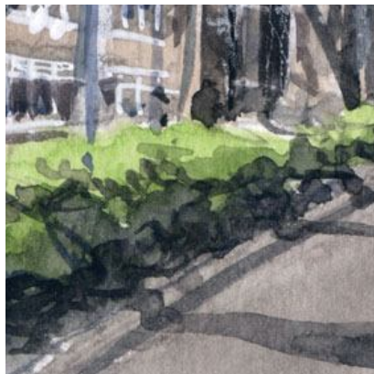
5、歩道左側の灌木の植え込み 影の部分は思い切って暗くします