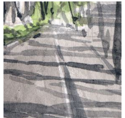
6、歩道に樹木の影を描くことで 日差し(晴れの天気)を表現できます