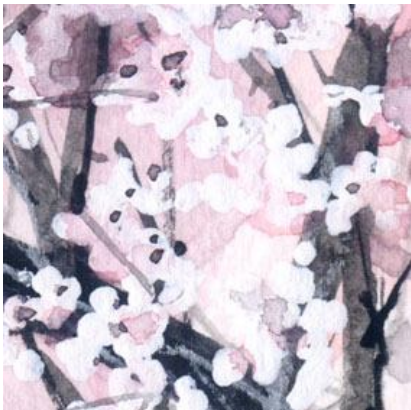
1、桜は「修正液」で描きました その後少し絵の具で加筆しています