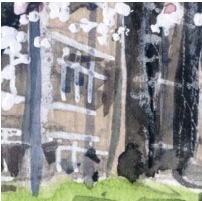
4、桜の背後の小学校の校舎も 「春」を表現する良い材料になります