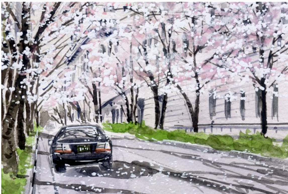
これが完成した絵です

桜の季節になると 本格的に自転車通勤を始めます 門前仲町～永代橋～小網町～江戸橋～日本橋～呉服橋・・・といった径路で 江戸の桜の名所を 職場まで約40分 春を楽しむ通勤です 帰路は大抵夜桜です 中でも一番美しいのは 日銀と三越協の「江戸桜通り」です 大勢の人が カメラやスマホを構えています