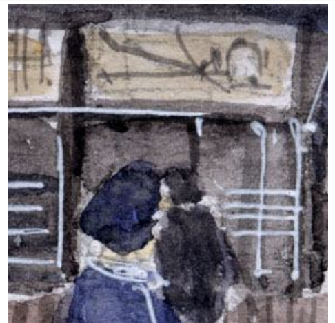
3、出札口の雰囲気も難しい 掲示してある路線図は もう少し丁寧に描けばよかった