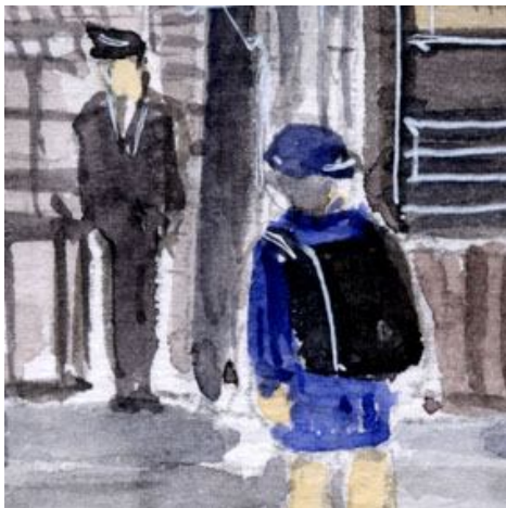
4、若い駅員さんと 通学中の男の子 ランドセルの立体感に工夫がほしかった