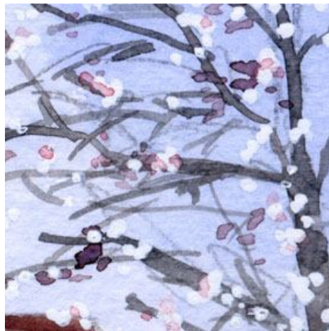
5、梅の花で季節感を出しました 実際に駅前にも梅の木がありました