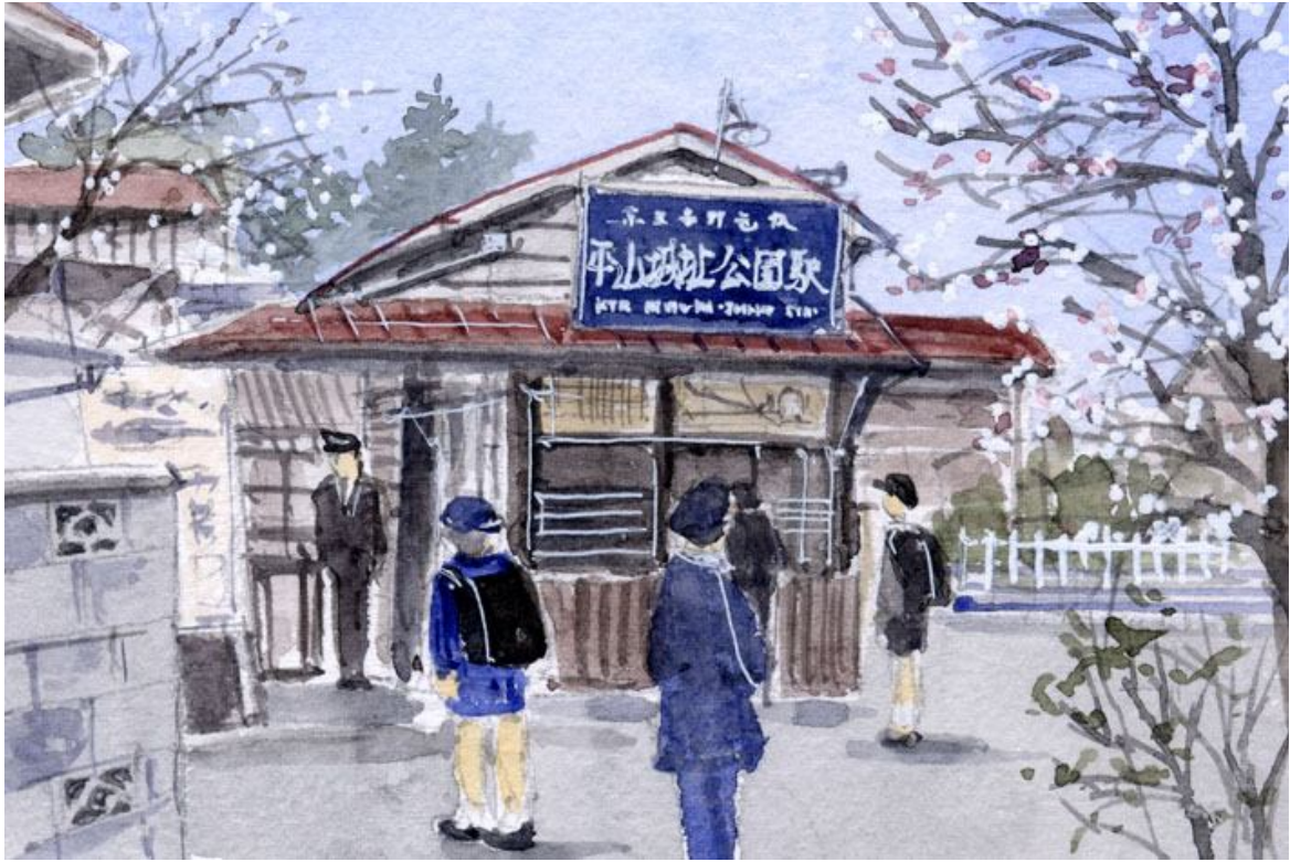
これが完成した絵です

昭和40年代の京王線・平山城址公園駅です 切符の自動販売機もなく 駅前には小さな駄玩具屋さんがあって よく銀玉鉄砲を買いました 手芸のお店もあったような気がします 私は小学校入学から高校卒業まで 通学で毎日この駅を利用していました 府中駅まで通っていた小学生時代には 改札を入れてから渡った踏切のところで 八王子から来る友達がいつも待っていてくれました その後駅は新宿寄りに移転しました 先日駅舎があった場所に行ってみました お店も踏切も 何もなくなっていました