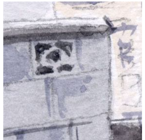
6、この孔のあいたブロック塀にも 私はひどく懐かしさを感じます