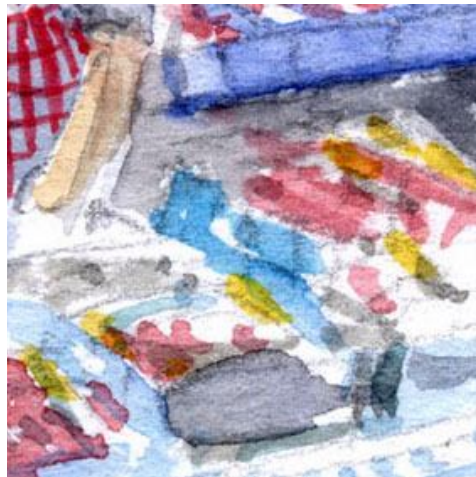
5、お土産物がたくさん並んでいる様子がとても表現できませんでした