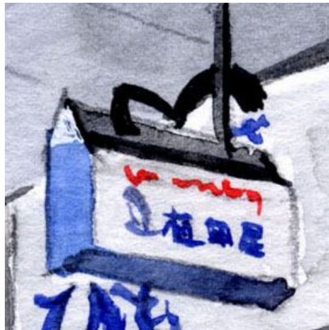
2、アーケード屋根からの吊り看板 カモメの飾りに もう少し工夫がほしかったです