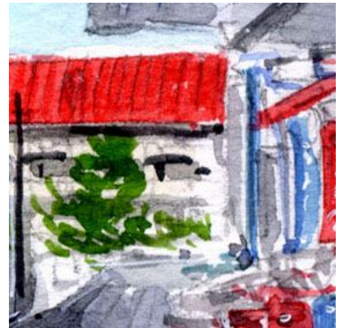
6、遠くに見える銚子駅の赤い屋根 少し彩度を落としたほうが良かったです