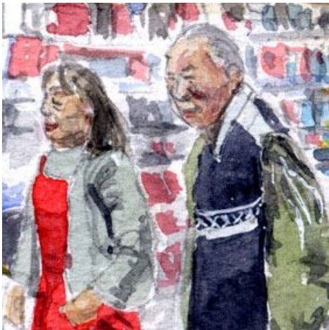
4、ご主人と奥様 明るく元気な性格をそのまま描きたかったのですが 難しかったです