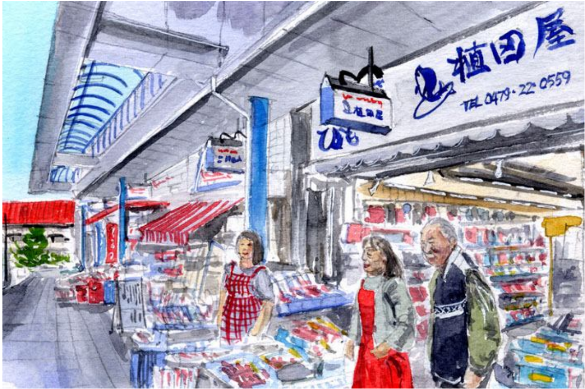
これが完成した絵です

銚子の駅前通りに 何軒かの土産屋さんが並んでいます そのうちの軒が「植田屋さん」です 私は銚子を訪れると 必ずこのお店に寄ります いろいろな銚子名物を揃えていて 楽しいです お店の人も元気で親切 お願いしておくとも 珍しい貝殻も取り寄せてくれます 最近「四季水彩の銚子ポストカードセット」も置いてもらっています 銚子を旅行されたら 是非お立ち寄りください