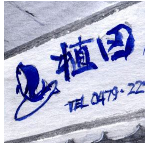
3、看板の文字は「お店の顔」ロゴも字体もなるべく正確に描きます