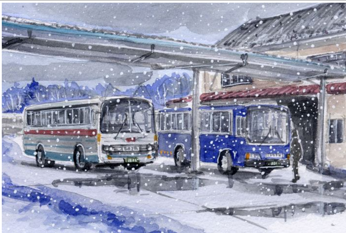
これが完成した絵です

軽井沢駅前から草津温泉行のバスが出ています その中間点が北軽井沢です かつてはここにバス営業所がありました タクシーの事務所や 屋根のついたバス乗り場もあり いかにもこのあたりの交通の中心地という雰囲気でした 今はバス停が立っただけですっきり淋しくなっていました 向かいにある北軽井沢駅舎の軒下にバスを発着させたら さぞ活気のある景観になるでしょう