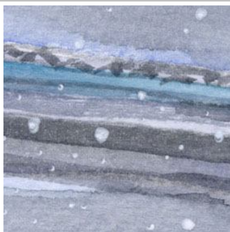
2、バスの上にある屋根が難しいです 立体感 はあまり意識せずに描きました