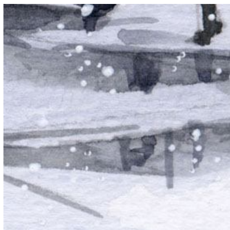
5、雪がとけてできた水たまりの表現は も う少し研究が必要です