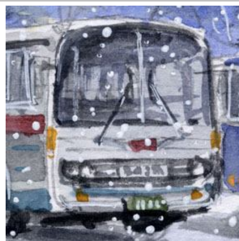
3、少し旧式のバスです バスの顔は 電車 よりもっと難しいです 車内の様子も描き ます