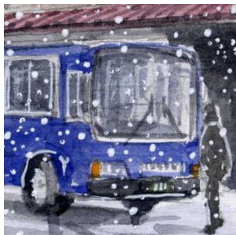
4、人物は運転士さんでしょう 雪の中 で少し寒そうな感じに描きました