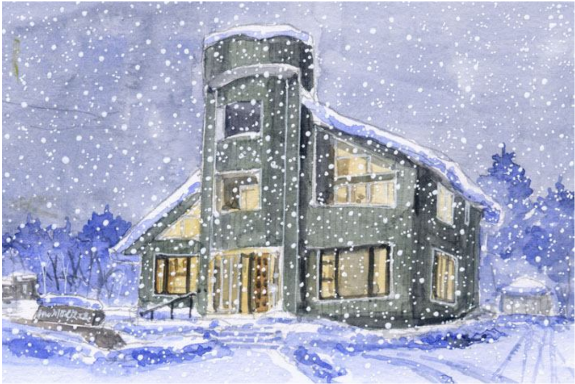
これが完成した絵です

川口建設というのは 北軽井沢の中心部にある建設会社です 別荘やリゾートマンションの管理業務にも力を入れていて 私もいろいろなことをお願いしています 中心に円筒状の構造がある この美しい建物を 私は何度か描きました しかし雪の風景はまだ描いていませんでした この連休は広範囲で天気が悪くなりそうなので こんな景色が見られるかも知れません