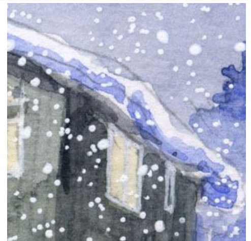
3、屋根から落ちそうになっている雪の様子 コバルトブルーで影をつけます