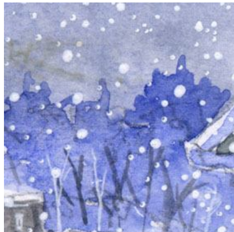
5、背後の森もブルー一色だけで表現しました「ブルーのシルエット」という感覚です