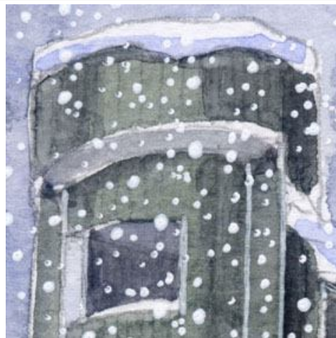
2、円筒状の構造は 立体感が難しいです 両端付近に 少し影をつけると良いでしょう