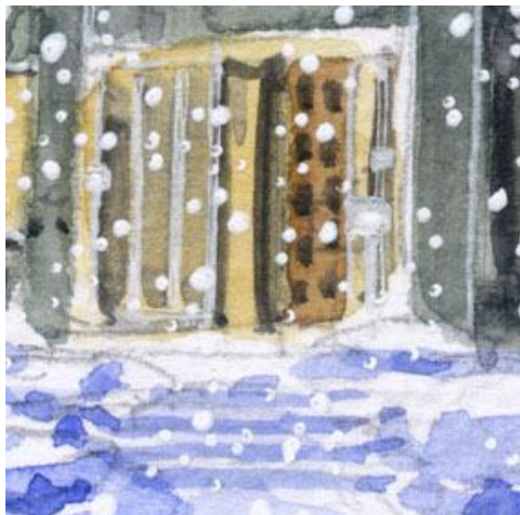
4、建物の入口は 何種類かの茶色を使います 雪に覆われた階段も重要なポイントです