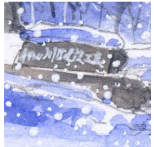
6、玄関前の看板 文字だけ丁寧に書きたくなりますが 全体のバランスを考えて