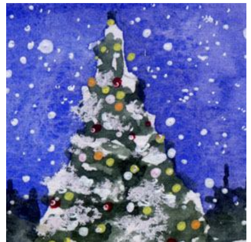
3、手前のツリーに積もった雪に 白のペーステルを使用しましたが これはやめたほうがよかったです