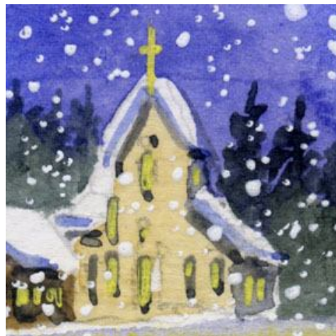
5、教会の壁は ジョンブリアン(肌色)にレモンイエローを混色しています