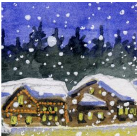
4、雪の積もった民家や商店は もう少し丁寧に描いたほうがよかったと 反省しました