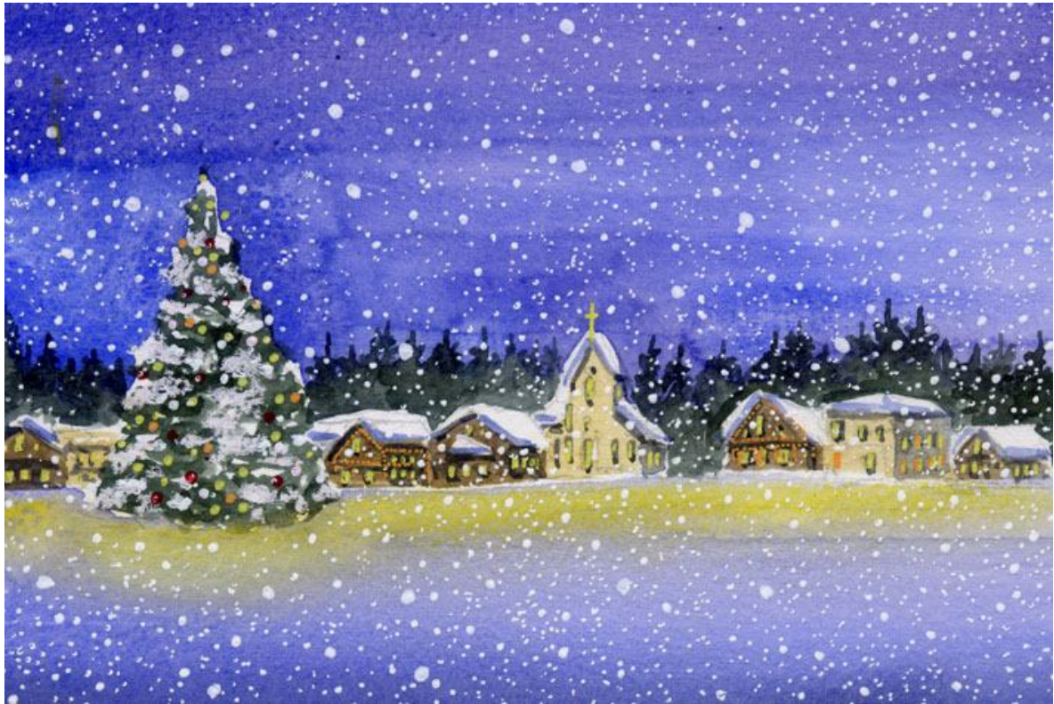
これが完成した絵です

どこの街だか思い出せません たぶんスウェーデンのどこかです ヨックモックかピットタンギかヴェルヘルミーナか・・・毎年12月20日を過ぎると この風景が夢に出てきます 今夜もこの街に行ってきます