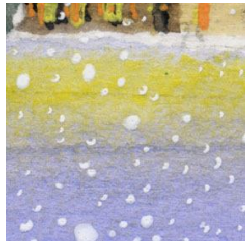
6、手前の雪への反映は 黄色と白のペーステルを指でのぼして表現しました