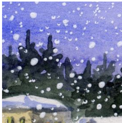
2、背後の針葉樹の森は シャドウグリーンに更にブラックを加えて描きました