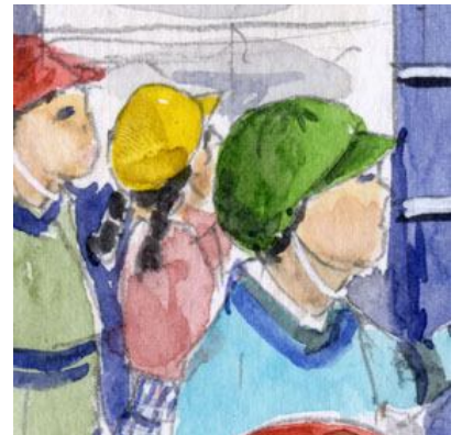
6、見学中の子どもたち。もう何人が描いてもよかったです。画面に収まりませんでした。