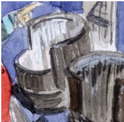
4、内側が白い古い桶が一番難しかった。縦のタッチで少しずつ立体感を出すしか方法がなかったです。