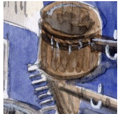
3、柄杓や攪拌の道具。古い木の質感を出すのが難しいです。