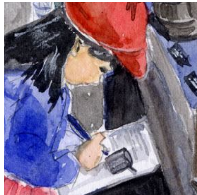
5、ノートをとっている手前の女の子が難しい。ペンを手にとっている様子も、もう少し研究が必要。