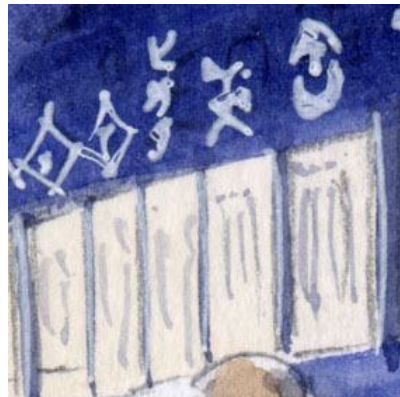
2、壁面に描かれた意匠。ここだけ丁寧に描くのはよくないが、やや細かくなってしまった。