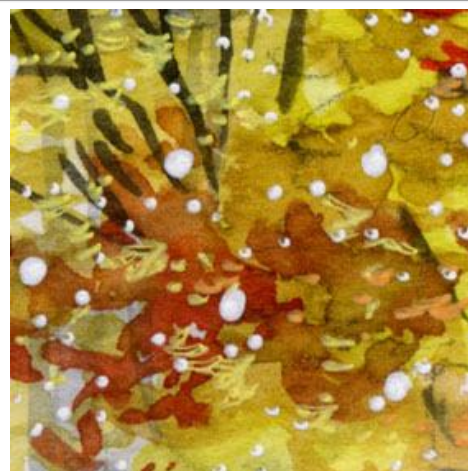
3、イチョウなど 黄色く色づく木々も大切です 樹木の枝は 細い「形状記憶筆」を使っています