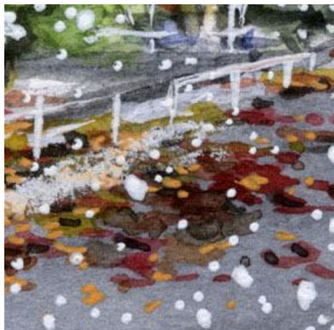
4、地面の落葉と わずかに積もった雪 雪は白のパステルを使用しました