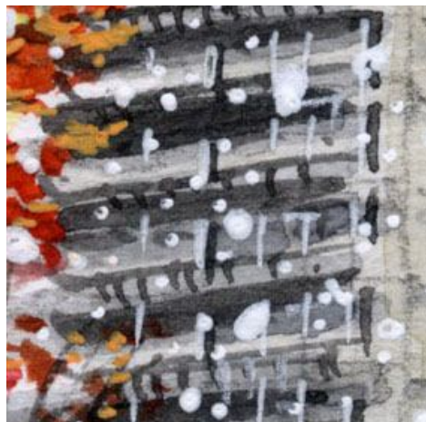
5、マンションは それぞれの階層の軒下を暗く表現します