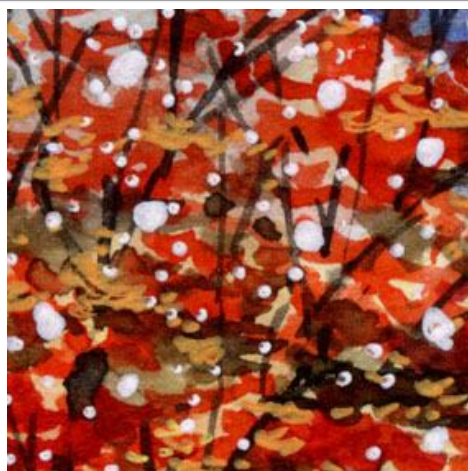
2、色づいたケヤキの手前の雪が この絵の主題を表現するのが 一番のポイントです