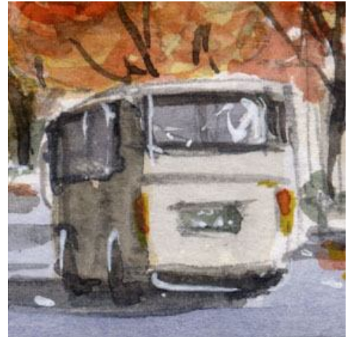
6、マイクロバスはあまり描いたことがなかったので 少々デッサン狂いが生じました