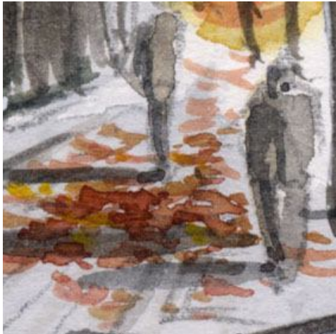
4、路面の落葉と歩行者 歩行者はもう少し研究したいと思います