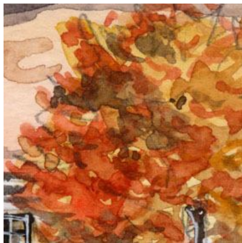
2、紅葉した街路樹は 黄→黄土→橙→茶→セピアの順に重ねてゆきます