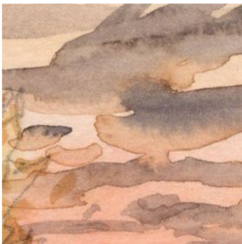
1、夕暮れの空模様は 偶然できた滲みや色の混ざり合いをそのまま生かします