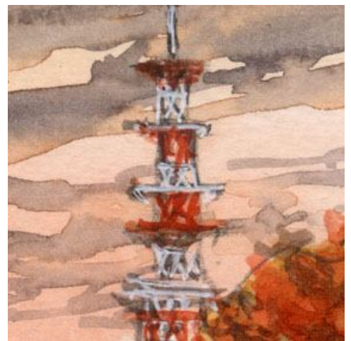
3、こういう電波塔は 地方都市らしさを表現するのに 便利な部品です