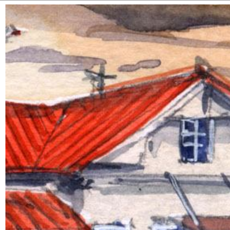
3、やや複雑な屋根の形状は 良く見てとにかく角度を誤らないように 注意深く描きます