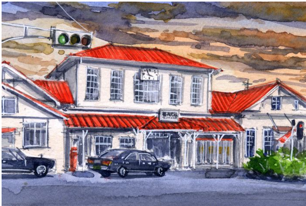
これが完成した絵です

もう30年近く前に 軽井沢駅から上り特急「白山」に乗りました 白山号は金沢～上野間を信越線経由で結ぶ 現在の北陸新幹線のような役割を果たしていました しかし本数は少なく 発車時刻ぎりぎりまで特急券も持っていなかった私は この駅舎に突進し 改札から一番近い扉に駆け込み乗車しました 車内で高校時代の友人にばったり出会い 当時はまだ営業していた食堂車で楽しいひと時を過ごしました 昭和時代の「古き良き」思い出です