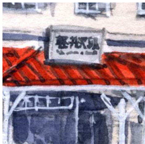
4、駅名版は ついつい丁寧に描きたくなりますが 細筆でほどほどの丁寧に