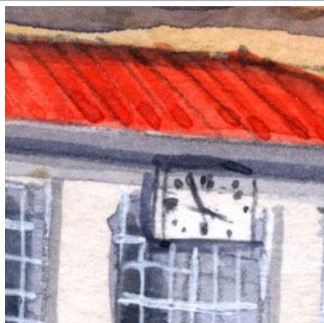
2、赤い屋根も3回塗り重ねています 時計はあまり丁寧に描かない方が良いでしょう