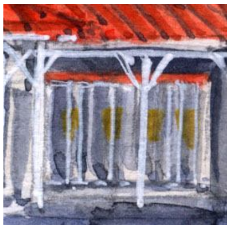
5、軒下の電話ボックス列も 時代を感じさせる演出です 中の電話も「黄色」です