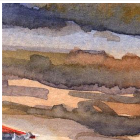
1、夕焼け雲(層積雲)は 横のタッチで描きます 「生乾き」で重色するのがコツです