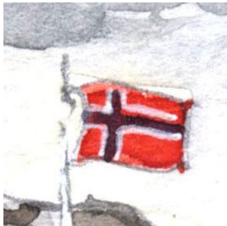
5、国旗はその国のシンボルですから 正確に 美しく描くことが大切です