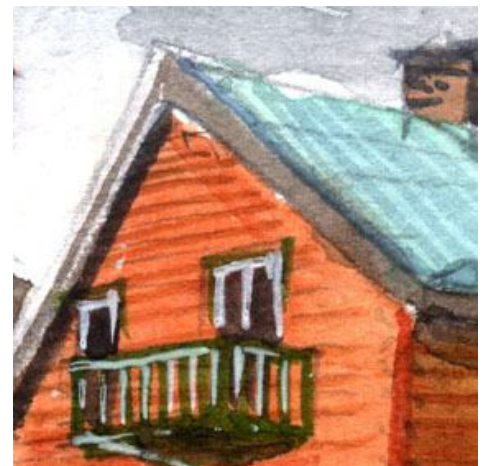
3、主題の民家は ベンガラ色の壁が決定的に重要です 窓枠の白も重要