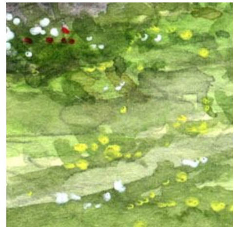
6、手前の草原の花々も大切です ここはすべてが完成して 最後に描きました