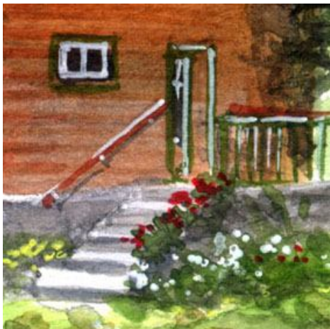
4、この階段と手摺に かなり手こずりました 手前の花が北欧の民家らしくて気に入っています